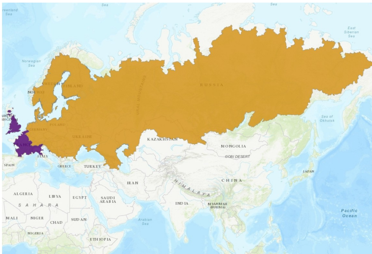
Figura 4. Mappa della distribuzione mondiale di C. carassius (giallo: distribuzione nativa, viola: distribuzione invasiva).