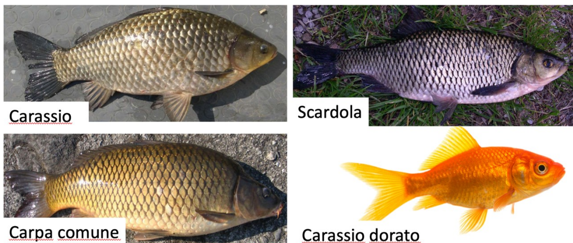
Figura 4. Confronto morfologico tra il carassio ( Carassius carassius ) e specie simili: Carassio dorato ( Carassius auratus ), scardola ( Scardinius erythrophthalmus ) e carpa comune ( Cyprinus carpio ).