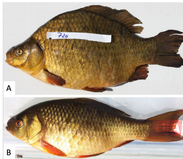
Figura 5. Esemplari di carassio con morfologia influenzata dalla presenza di predatori nell'ambiente (A) e in assenza di predatori (B) (Foto adattata da Olsén e Bonow, 2023).

Etologia: L'etologia del carassio è caratterizzata da un'elevata plasticità fenotipica e da strategie comportamentali adattative che ne favoriscono la sopravvivenza. In presenza di predatori, la specie può modificare la propria morfologia sviluppando un corpo più alto e robusto, che ne migliora la difesa contro eventuali attacchi (Fig. 5). Allo stesso tempo, riduce l'attività locomotoria e si rifugia nella vegetazione, limitando l'esposizione al pericolo. Questi cambiamenti morfologici e comportamentali possono essere indotti anche da segnali chimici rilasciati dai predatori della specie (ad esempio luccio o persico), evidenziando la spiccata sensibilità olfattiva del carassio (Olsén e Bonow, 2023).