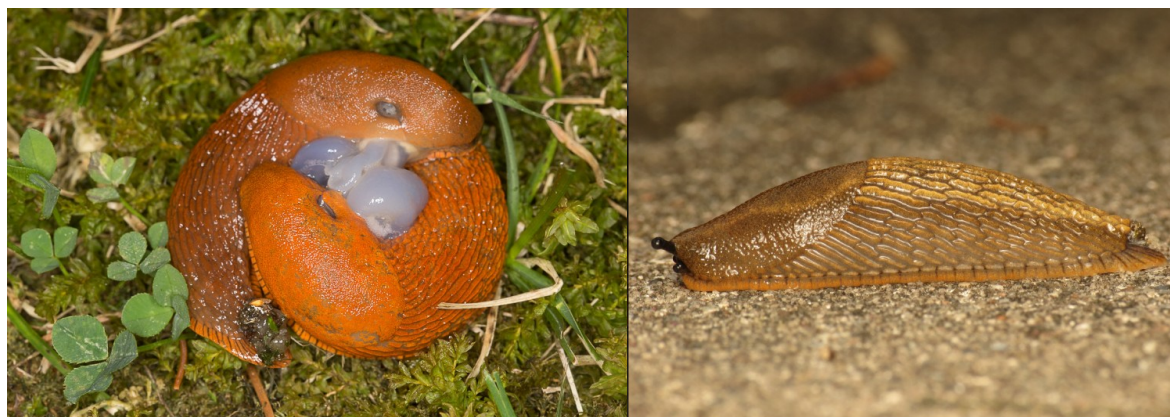
Fig. 1. Esemplari di Arion vulgaris .

Inglese: Spanish slug, Iberian slug, Vulgar slug, Large red slug.