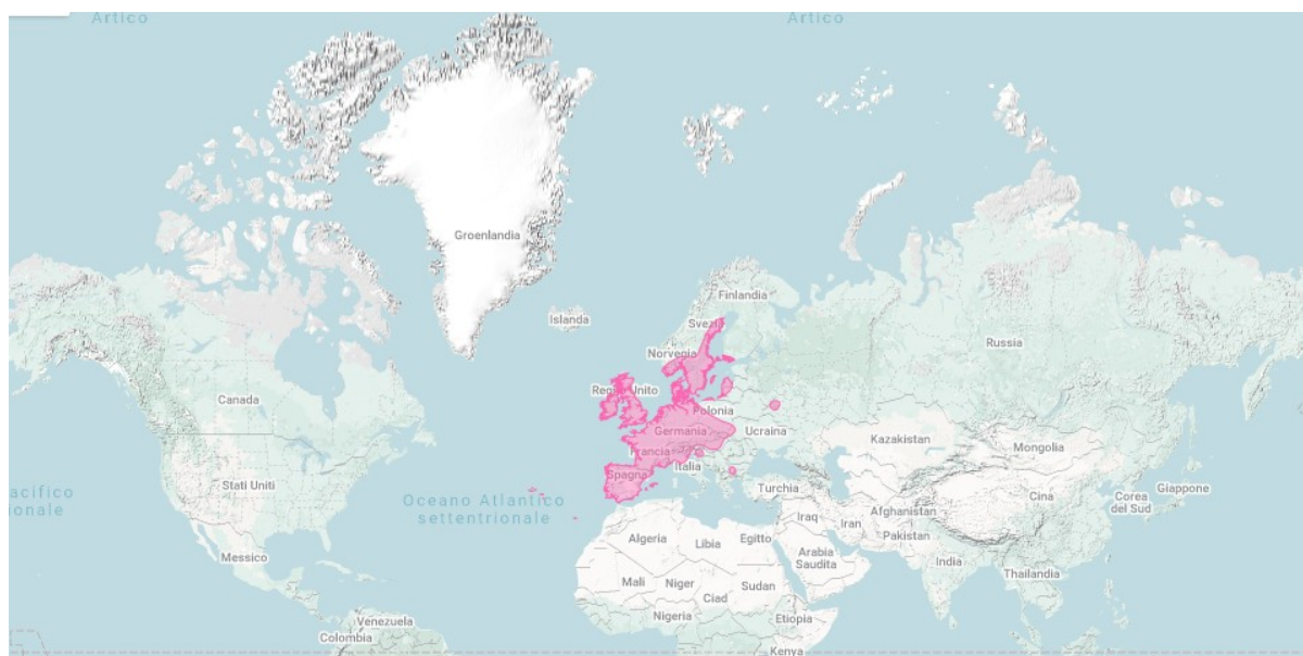
Fig. 3. Mappa dell'areale originario di Arion vulgaris su inaturalist.org.

La riproduzione anche parziale della presente scheda è permessa a condizione che se ne citi la fonte come segue: