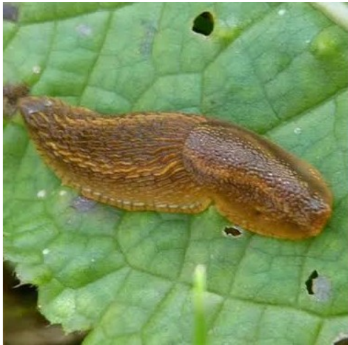
Fig. 2. Esemplare giovane di Arion vulgaris

A. vulgaris è un gasteropode terrestre privo di conchiglia e di dimensioni relativamente grandi con un corpo cilindrico lungo fino a 120 mm. Si distingue per la caratteristica variabilità cromatica tra adulti e giovani. Infatti, gli adulti presentano una colorazione bruno scuro, rosso mattone o arancio, a cui si devono i diversi nomi con cui viene chiamata questa specie; i giovani, invece, sul corpo presentano bande laterali, che scorrono longitudinalmente, con una banda scura sormontata da una più chiara. Il dorso non presenta la carena e posteriormente il corpo è costituito da una ghiandola grigionerastra per la produzione di muco (Nardi, 2011).