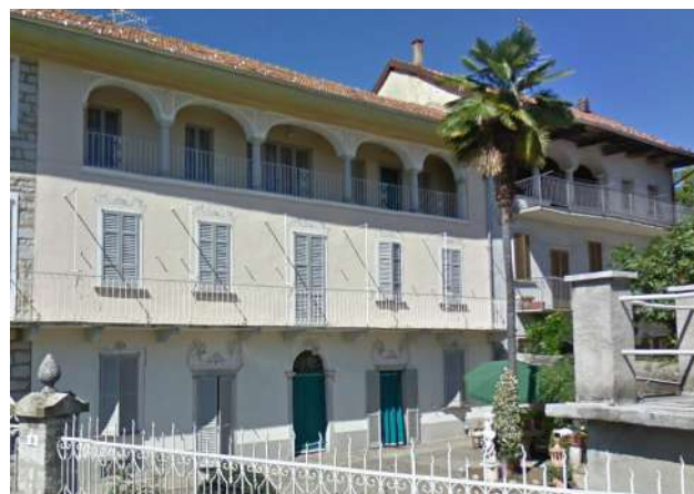
Edificio a Niverate

Da rilevare anche a San Maurizio la presenza di decorazioni pittoriche, molto diffuse in tutto l'arco alpino ma caratteristiche anche del lago d'Orta. Sarebbe possibile recuperare queste tecniche e utilizzarle anche in edifici recenti: potrebbe diventare un elemento caratteristico del recupero e della riqualificazione degli edifici della fascia a lago.