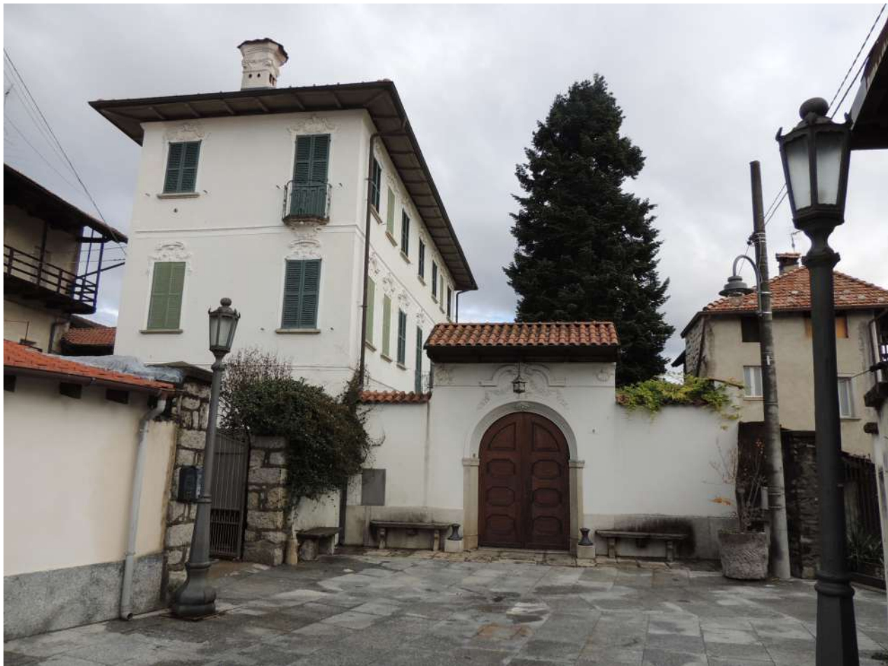
Villa Vandoni vista dalla piazzetta del paese sulla quale si apre il portale di ingresso al giardino antistante

La villa risale al tardo Settecento. Le finestre, sormontate da una cimasa dall'elegante disegno barocco, e la linearità delle sue facciate le conferiscono un tono gradevole e distinto.