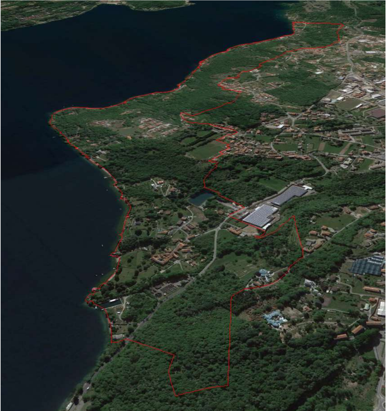
Perimetro su foto aerea del Piano paesistico