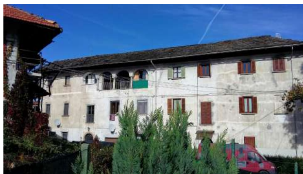
Edificio a Niverate