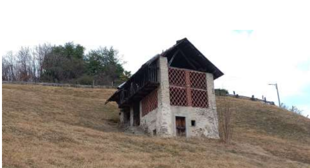
Edificio a Briallo

Nella zona montuosa circostante il Lago d'Orta fino a qualche decennio fa esistevano molti edifici con copertura di paglia. È difficile immaginarne un recupero, dal momento che le tecnologie relative, pur non essendo particolarmente difficili, sono di complessa "organizzazione" (raccolta del materiale, educazione della mano d'opera, esecuzione, manutenzione, protezione dagli incendi).