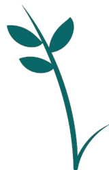
Pianta in fase di crescita