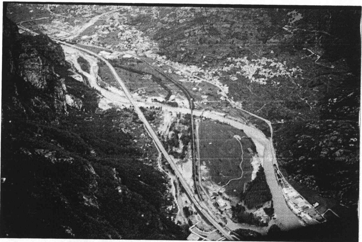
Fig.3 - Fiume Dora a nord di Quincinetto: canale laterale attualmente regimato attraversato dal rilevato autostradale. In primo piano si osserva il tratto di rilevato ferroviario asportato.

I danni maggiori sono stati però causati da esondazioni, con coinvolgimento di molti edifici, soprattutto nel tratto terminale della valle, a nord di Ivrea, ma anche nel settore compreso tra Quincinetto e Tavagnasco ed a Quassolo. A nord di Quincinetto l'alveo della Dora, originariamente pluricursale è stato modificato in monocursale per regimazione del deflusso dei canali laterali. In occasione della piena del settembre 1993, la Dora ha inondato, in sponda destra, aree comprese tra l'alveo attuale ed i canali regimati, coinvolgendo edifici, distruggendo opere idrauliche, riattivando parte dell'antico corso pluricursale. I rilevati autostradale e ferroviario che attraversano l'area, hanno condizionato pesantemente la distribuzione degli allagamenti; il rilevato ferroviario in particolar modo ha impedito alle acque di inondazione di rifluire verso la Dora. Nella zona dove i due rilevati convergono si sono registrate altezze delle acque sul piano campagna prossime ai 4 m. Il rilevato ferroviario è stato prima trascinata e successivamente demolito per un tratto di un centinaio di metri (Fig.3)