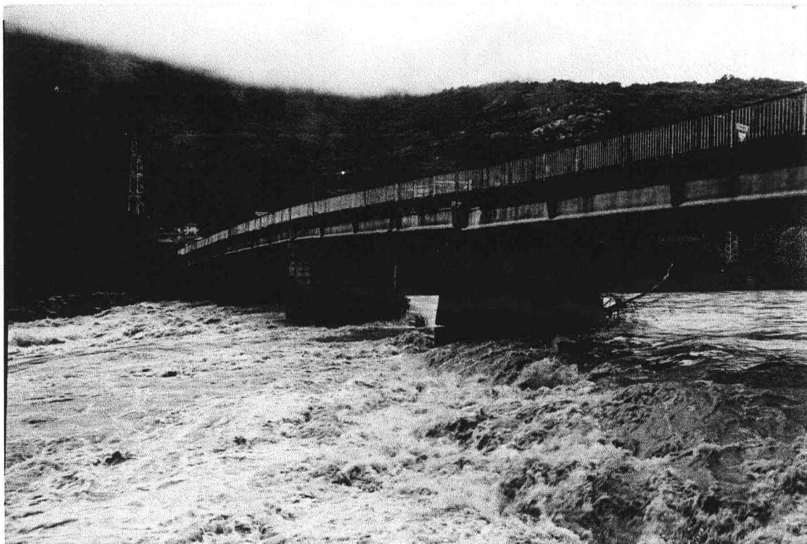
Fig.2 - Ponte di Quassolo: pila scalzata per accentuata erosione di fondo.