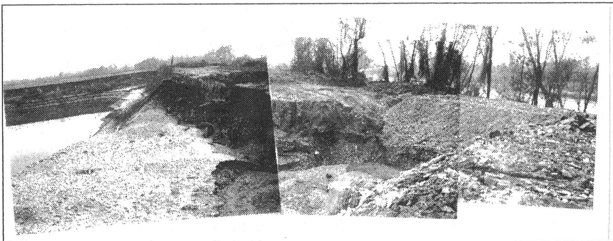
Fig. 5 - Particolare del punto B di fig. 4.

Superato il setto, le acque defluendo in cascata per alcuni metri, lo hanno demolito completamente per erosione rimontante. Non è da escludere che si siano anche verificati simultaneamente processi di sifonamento per infiltrazione delle acque alla base.