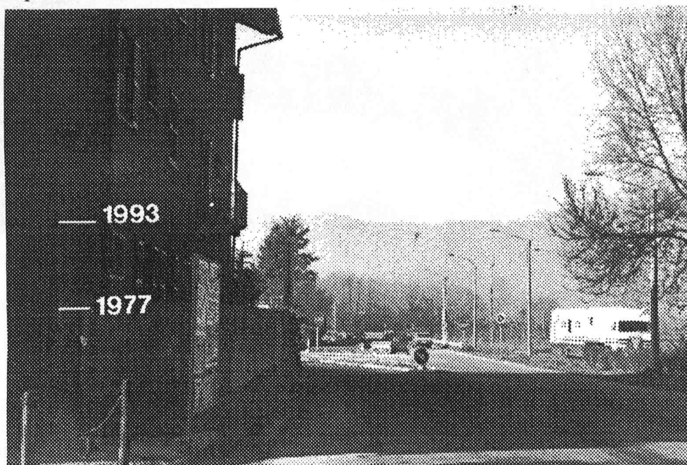
Fig.6 - Banchette: altezze delle acque di inondazione durante gli eventi del 1977 e del 1993.

L'agglomerato urbano costituito da Banchette e da Ivrea è stato interessato da estesi allagamenti, con altezze d'acqua, dedotte da tracce lasciate sugli edifici, anche superiori ai 3 m (Banchette). A Banchette, il livello delle acque nell'edificato è stato superiore a quello rilevato durante le piene del 10/1977 e del 9/1948, tra le maggiori dell'ultimo secolo (Fig. 6).