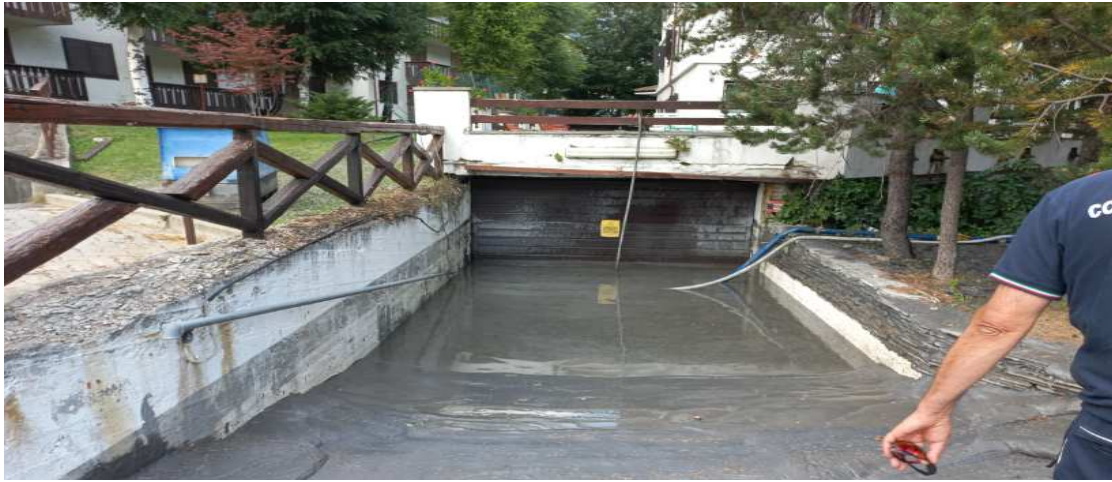
Attività in Viale della Vittoria 4 presso l'Hotel 'La Betulla'