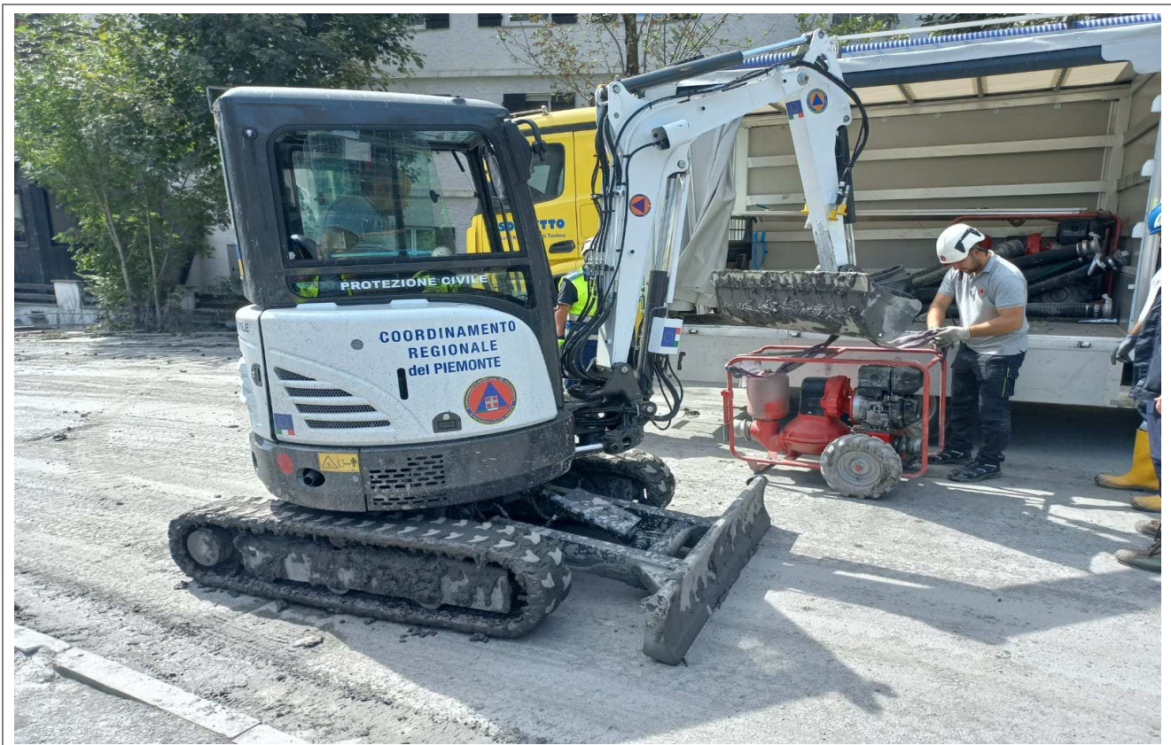
Fasi di lavorazione con miniescavatore