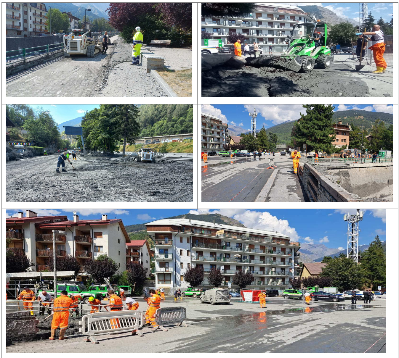
Attività di ripristino ad opera del Volontariato di Protezione Civile

Le prime attività sul territorio, hanno visto all'opera il Volontariato di protezione civile sin dalla sera di domenica 13 agosto ed in modo più consistente, a partire dal giorno seguente, lunedì 14 agosto. Il coinvolgimento del Volontariato ha principalmente riguardato la rimozione di detriti e fango dagli edifici, talvolta in affiancamento a risorse private mobilitate dal Comune, la pulizia e il lavaggio delle strade, l'assistenza alla popolazione e il presidio delle aree di cantiere destinate alla rimozione e al trasporto dei detriti, con particolare riferimento alle chiusure stradali sulla SS 335 e sulla viabilità interna dell'abitato di Bardonecchia.