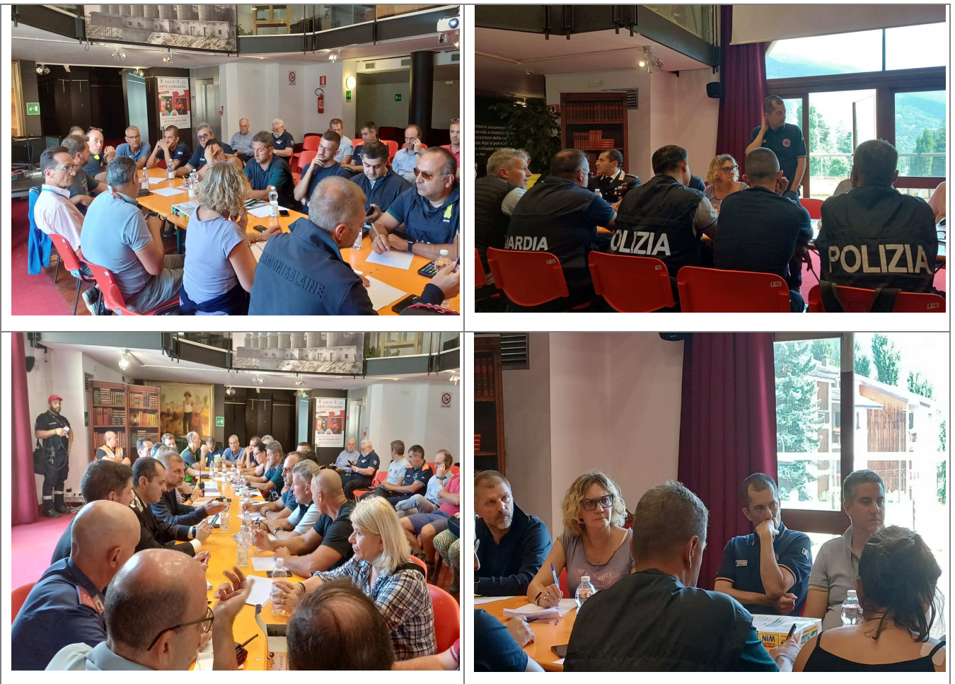
Alcuni momenti delle riunioni presso il COC di Bardonecchia

A seguito dell'occorrenza del fenomeno, il Servizio di Reperibilità del Settore, dopo aver ricevuto la sera del 13 agosto una comunicazione da parte di privati cittadini che descrivevano un fenomeno di colata in atto a Bardonecchia, ha verificato il fatto cercando un riscontro diretto da parte del Sindaco e raccogliendo le prime necessità. Dal giorno seguente, il Settore ha partecipato alle attività post-evento garantendo la presenza quotidiana di un funzionario presso il COC di Bardonecchia e il dispiegamento di un contingente del Volontariato, costituito da risorse del Coordinamento Regionale, del Corpo AIB e di ANC. Gli incontri giornalieri presso il COC, programmati al principio alle ore 8:30, 13:00 e 19:00 e successivamente ridotti ad un incontro del mattino, hanno consentito alle forze in campo di condividere la pianificazione delle attività post-evento e gli esiti degli interventi.