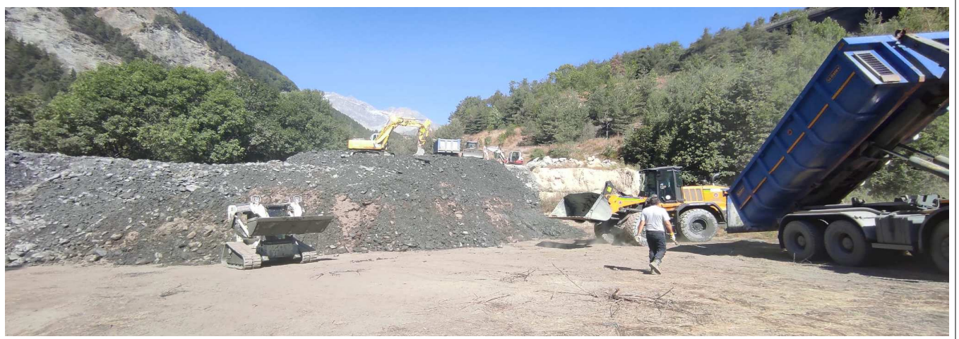
Operazione di scarico di materiale detritico presso il sito di accumulo temporaneo in località Genèves