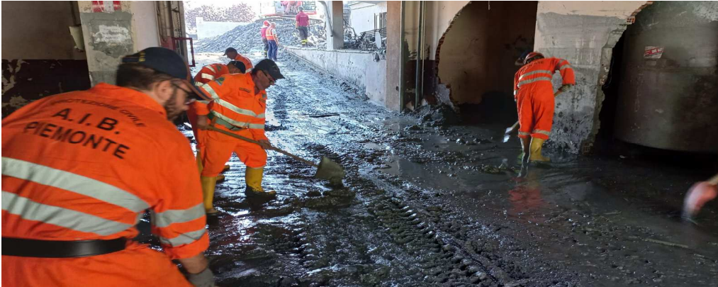
Attività di sgombero e pulizia presso il Commissariato