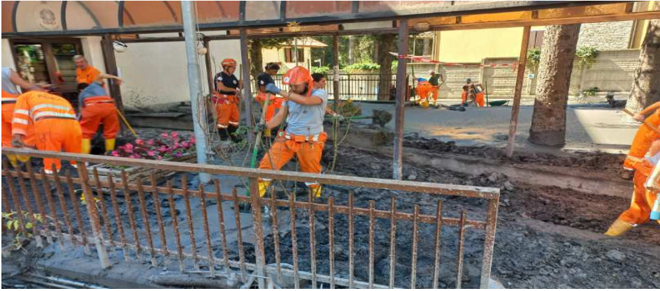
Lavori di ripristino presso l'ingresso pedonale del Commissariato di Polizia