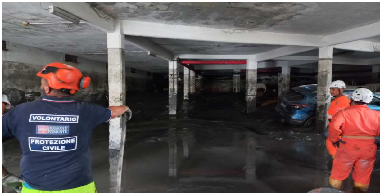
Attività in Viale della Vittoria 4 presso l'Hotel 'La Betulla'