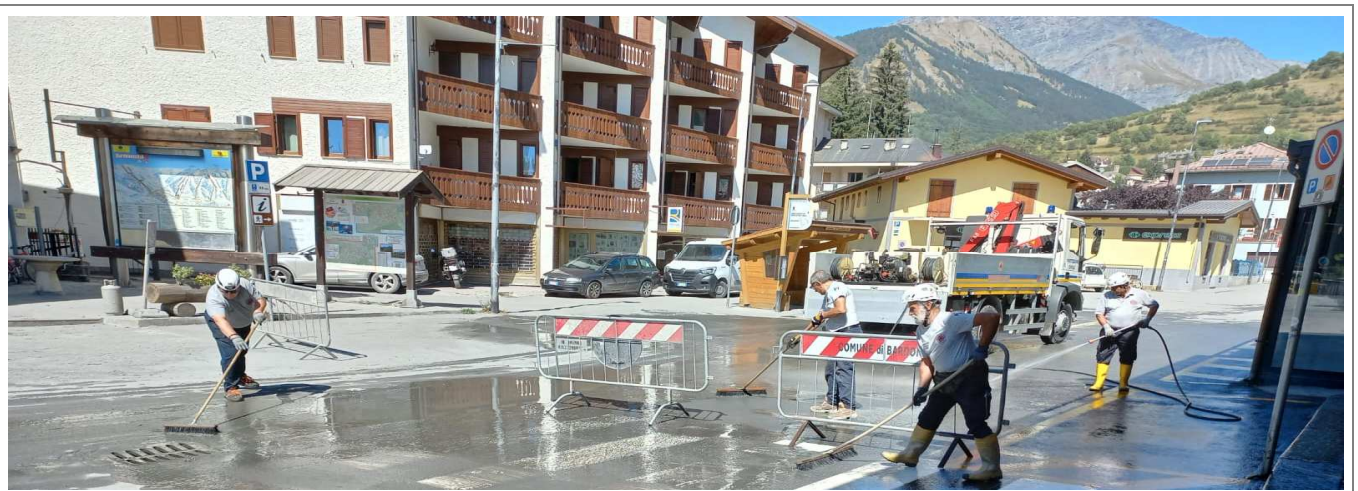
Attività di pulizia e lavaggio in Piazza Europa