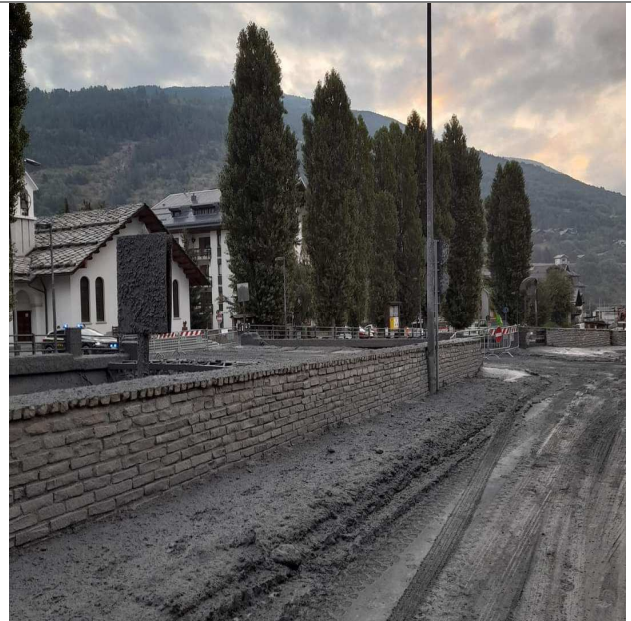
Effetti della colata detritica nei territori colpiti dall'evento