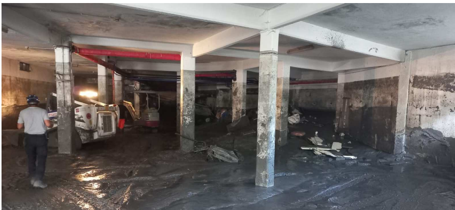
Sgombero detriti e fango presso Hotel 'La Betulla'