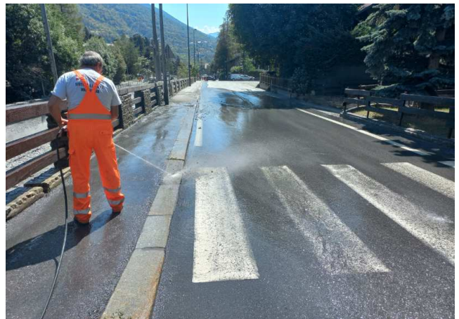
Rimozione detriti in Via Susa 23 a sinistra e pulizia e lavaggio strade in via Modane a destra