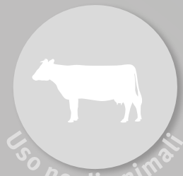
Uso negli animali

Gli antibiotici sono spesso utilizzati in modo inappropriato o senza una reale necessità, sia in ambito umano che veterinario. Migliorare l'uso degli antibiotici è la cosa più importante da fare per rallentare sensibilmente l'emergenza e la diffusione dei batteri resistenti agli antibiotici.