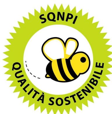
Figura 1: Logo del marchio Produzione Integrata previsto dal Sistema di Qualità Nazionale

SISTEMA DI QUALITÀ NAZIONALE PRODUZIONE INTEGRATA