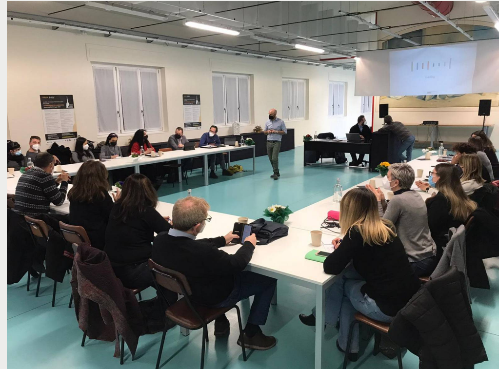
Incontro sul tema «formazione e lavoro» tenutosi presso la cooperativa Gerico il 23 febbraio 2022