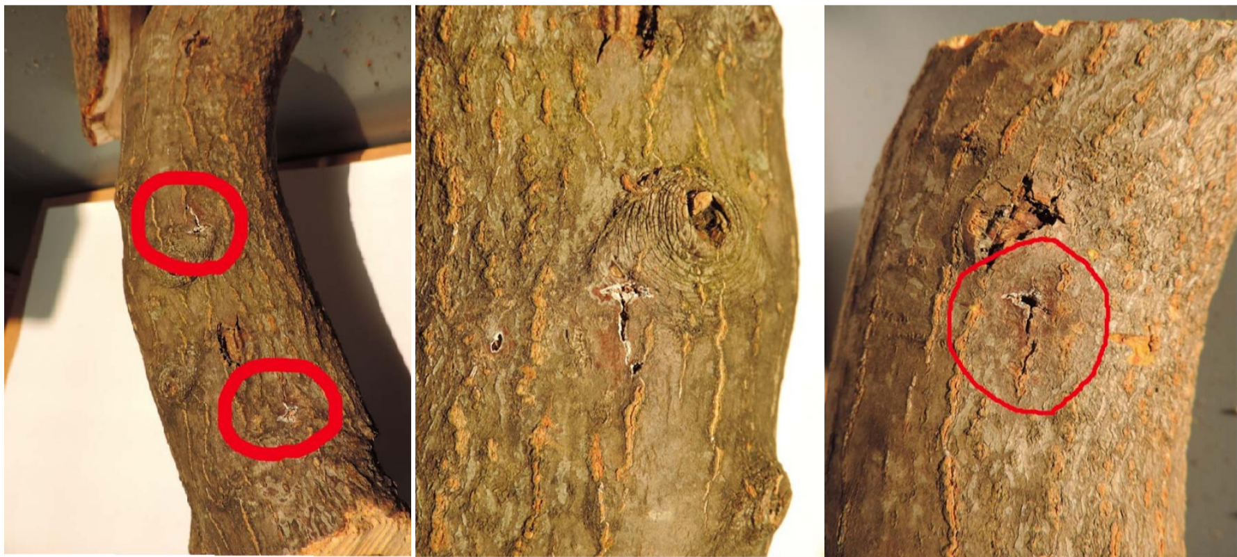
Foto sopra e in basso a destra : segni di ovideposizione su acero palmato

Acero palmato sui balconi: attenzione a questi segni!