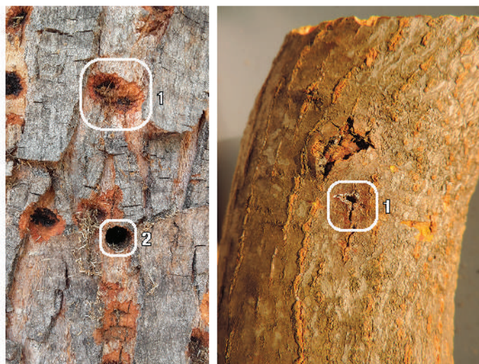
Foto a sinistra: segni di ovideposizione (1) e fori di sfarfallamento (2) perfettamente circolari di circa 1 cm di diametro.

https://www.ipla.org/index.php/patologie-ambientali/contrasto-organismi-nocivi