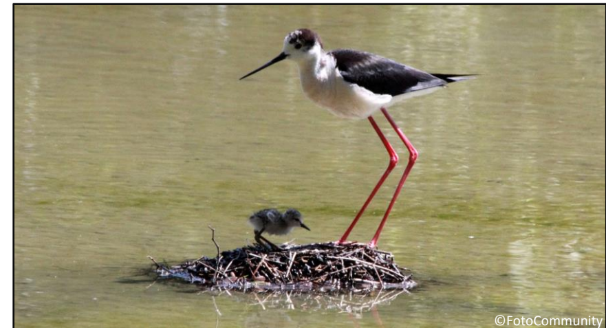
Cavaliero d'Italia al nido