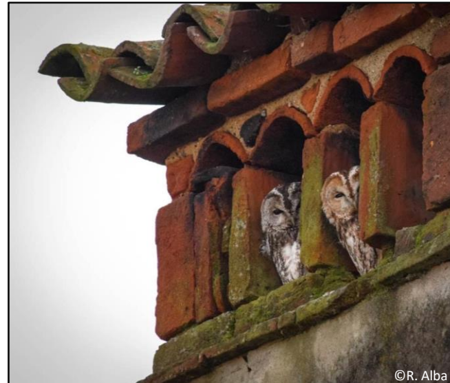
Allocchi con morfismi diversi