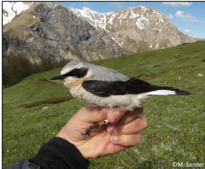
Culbianco nel Parco Naturale Val Troncea