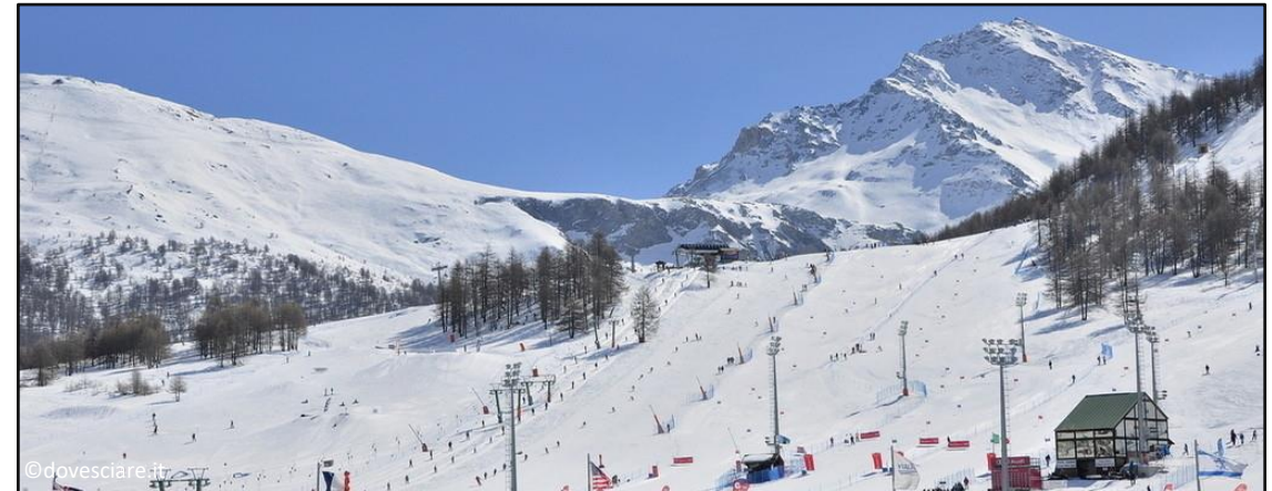
Impianti sciistici sulle Alpi Cozie