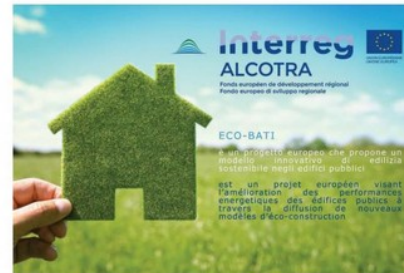
Catalogo di Prodotti Edilizi dotati di certificazione ambientale