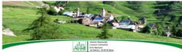
VERSO LE ELEZIONI? UNCEM: IL TAGLIO DEI PARLAMENTARI RIDUCE RAPPRESENTANZA TERRITORI. NECESSARI CORRETTIVI NELLA LEGGE ELETTORALE, ATTUALE SUDDIVISIONE IN COLLEGI PENALIZZA AREE RURALI E MONTANE

Il taglio dei Parlamentari - da 935 a 600 tra Senatori e Deputati - avrebbe gravi effetti sulla rappresentanza dei territori rurali e montani del Paese. La riduzione degli elettori e l'attuale struttura dei collegi elettorali (nazionali e plurinazionali) garantisce infatti la città, che in base ai numeri di abitanti continueranno ad avere un buon numero rappresentativo eletti nella Camera, mentre penalizza fortemente le aree ad bassa densità demografica con collegi multinazionali e plurinazionali.