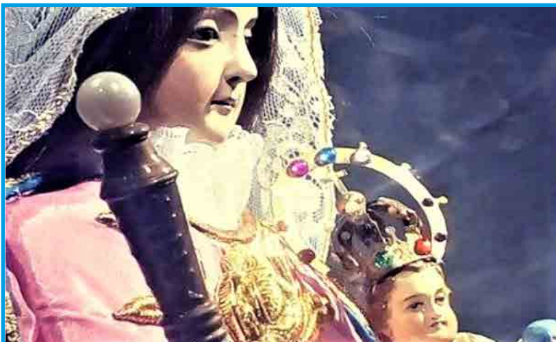
Imagen del Virgen del Rosario que preside la Catedral Metropolitana

Miguel de los padres jesuitas y donde parece hubo un oratorio dedicado al Arcángel San Miguel. Se hizo el plesbicito en Paraná y en las dos capellanías de la Parroquia : Alcaraz y la Matanza entre San Miguel, Santa Rosa de Lima y la Virgen del Rosario. En la Matanza (Victoria) se votó el 12 de Diciembre de 1824, en Alcaraz el 19 de Diciembre y en Paraná el 1 de Enero de 1825. En todos salió electa, con amplio margen, como Patrona Nuestra Sra. del Rosario quedando, más tarde, San Miguel como Patrono de la Provincia. Actualmente en la Plaza 1° de