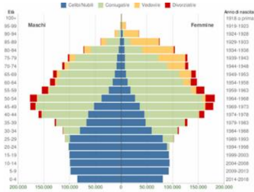
Popolazione per età, sesso e stato civile - 2018 PIEMONTE - Dati ISTAT 1° gennaio 2018