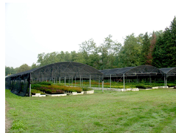
Vivai forestali della Regione Piemonte