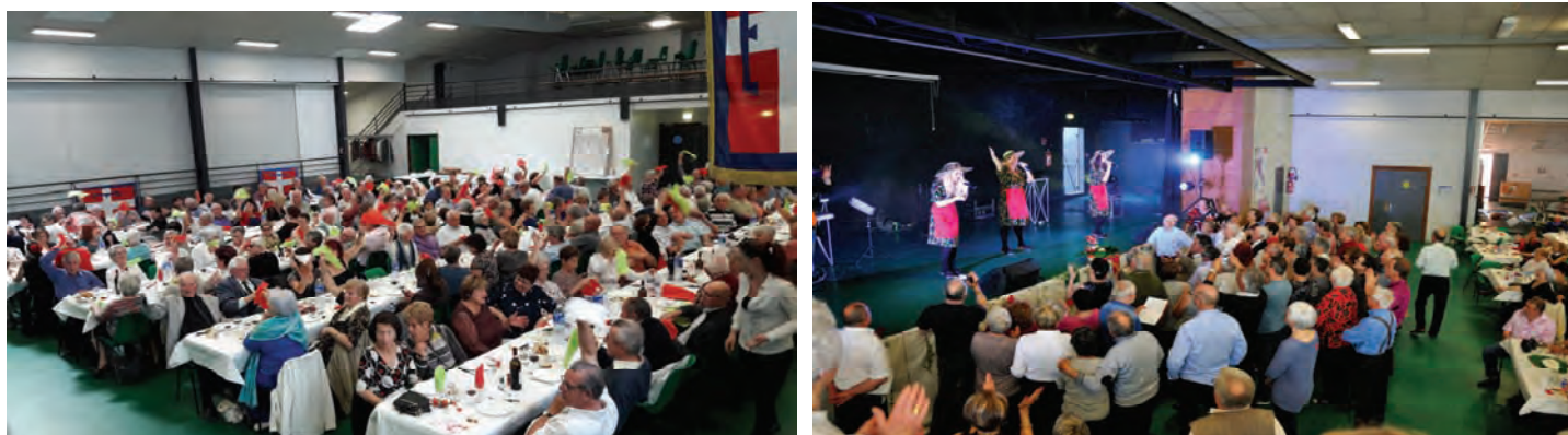
L'Associazione dei Piemontesi di Montauban (Francia) durante la festa sociale. A destra, l'esibizione del gruppo "Le Mondine"

In tanti all'assemblea generale dell'Associazione, finita con cena e danze