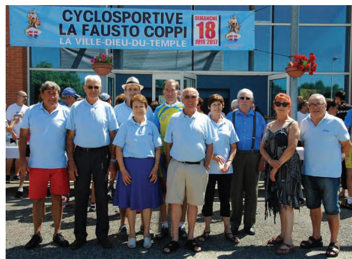
Gli organizzatori del raduno cicloturistico "Fausto Coppi", che registra ogni anno un crescente successo