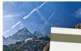
Il Piemonte occiden- Occitan