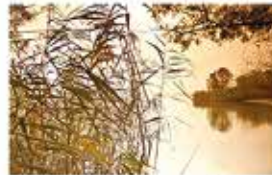
Il Nord Est del Piemonte dei laghi