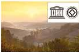
Il centro collinare del Piemonte