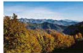
Il Nord Ovest delle valli alpine franco-provenzali