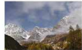
Il Nord Ovest delle valli alpine walser