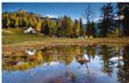
Il Nord Piemonte ossolano