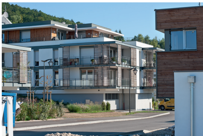
Logements Le Crêt Charlet, Argonay, concepteur : Patriarche & co

Il gruppo è composto da partner complementari sia come natura che come mezzi d'azione : associazioni d'interesse generale e di riferimento nel settore delle costruzioni (CAUE/AQC/iiSBE/Associazione Artigiani de Cuneo), esperti tecnici in architettura ed ingegneria edile (CMDL Manaslu Ing./Tautemi Associati Srl), Enti locali (Région Piémont, Commune de Vigone (It.) e un Istituto nazionale di formazione e ricerca (ENTPE).