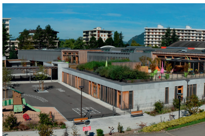
Ecole Vallin Fier, Annecy, concepteur : Catherine Boidevaix

Risultati attesi : capitalizzare le esperienze fra i partner transfrontalieri per aumentare la conoscenza degli edifici a basso consumo. Testare strumenti di monitoraggio e creare nuove procedure al fine di far conciliare l'efficienza energetica teorica degli edifici a basso consumo energetico con le loro prestazioni reali.