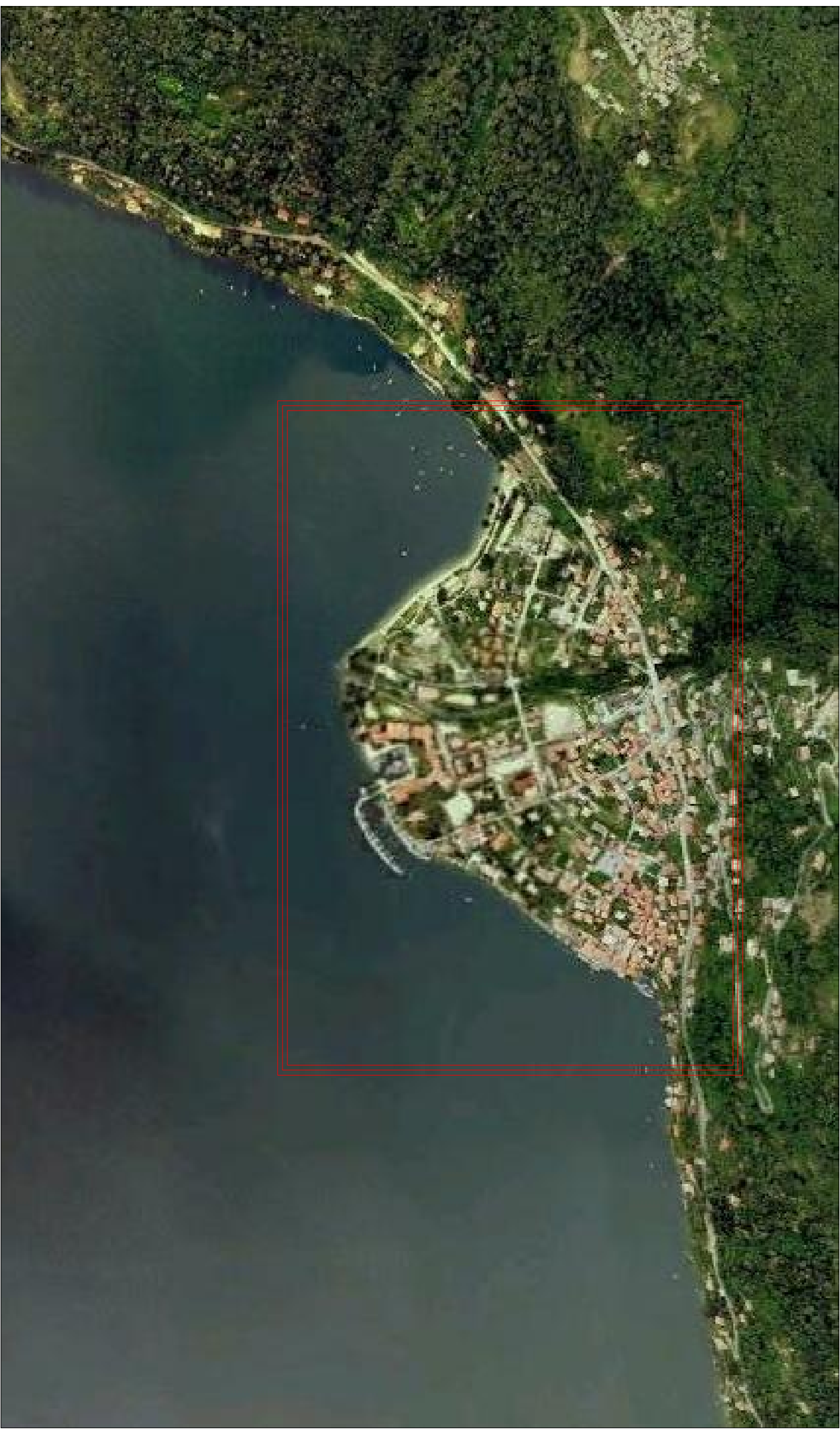
Ortofoto Comune di Cannero Riviera