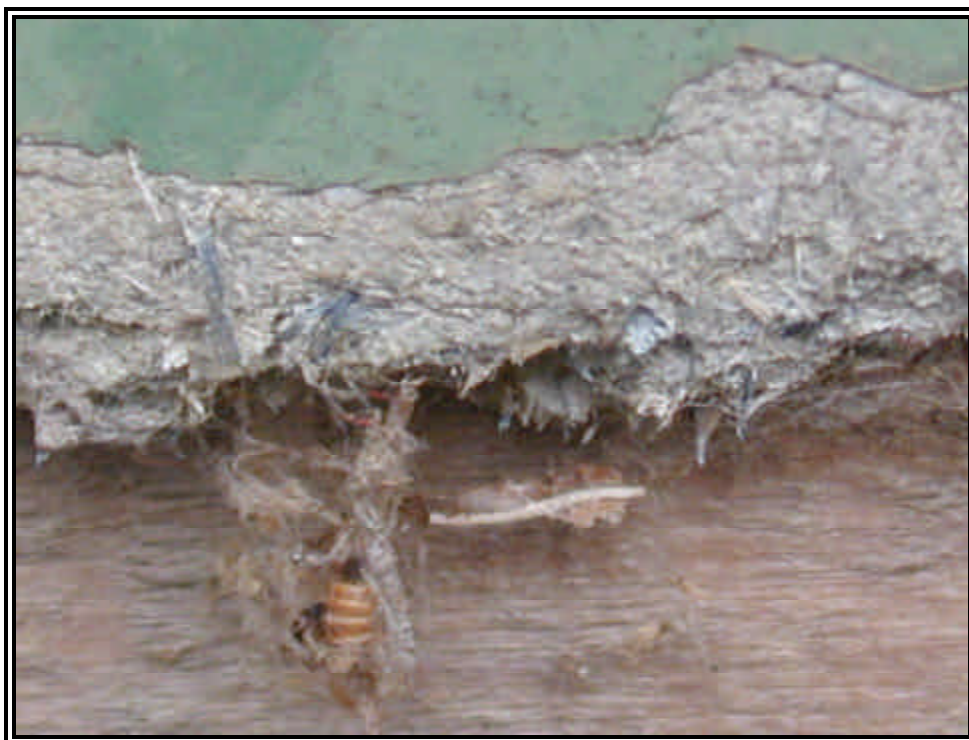
Rilievo fot. n°30