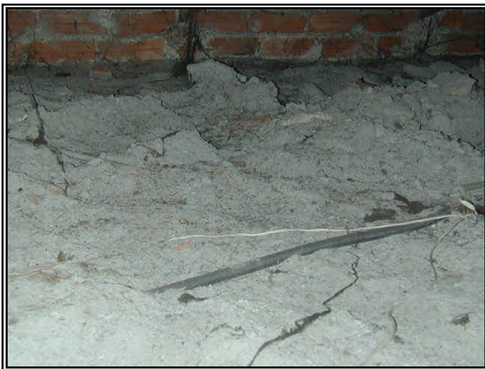
Rilievo fot. n°12

Direzione regionale Tutela e Risanamento Ambientale, Programmazione Gestione Rifiuti Via principe Amedeo 17 – 10123 Torino