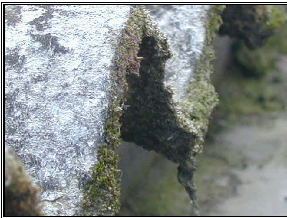
Rilievo fot. n°23