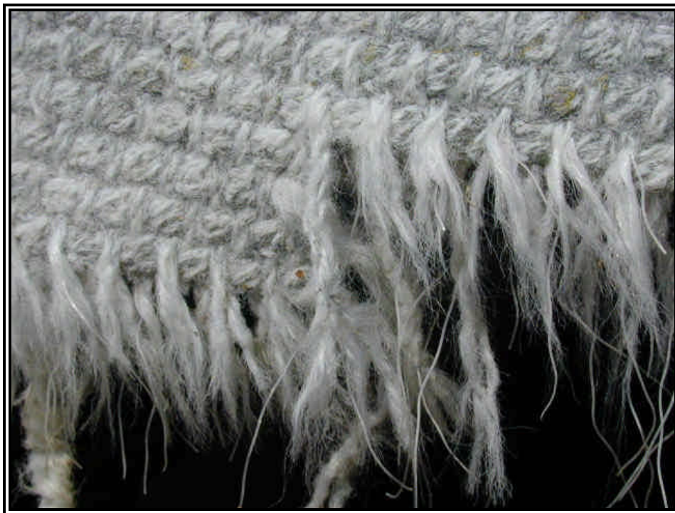
Rilievo fot. n°3