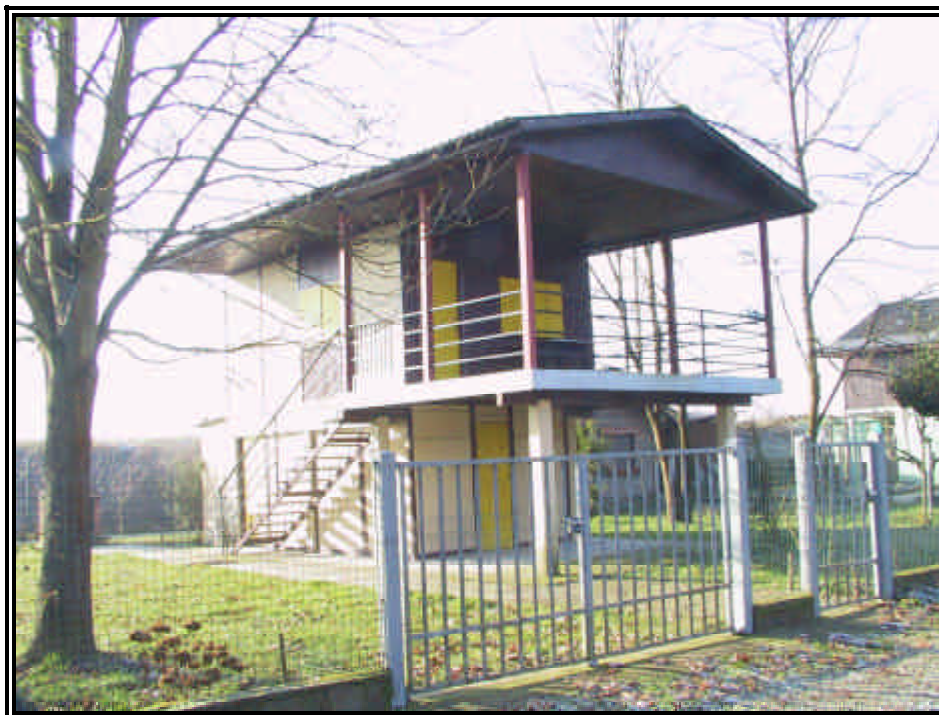
Rilievo fot. n°25