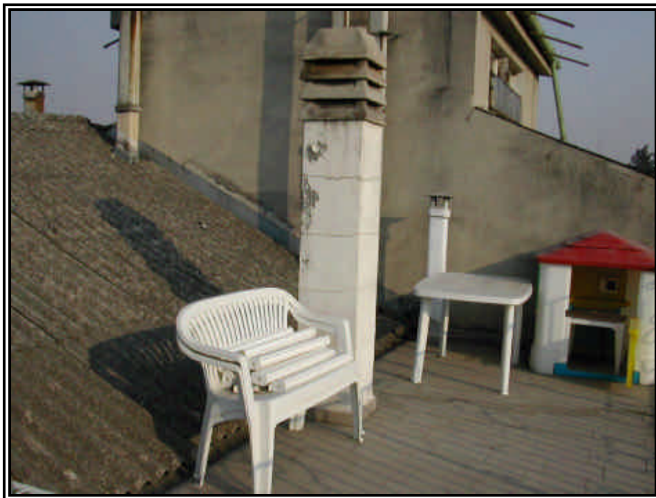
Rilievo fot. n°21