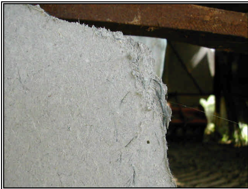
Rilievo fot. n°13