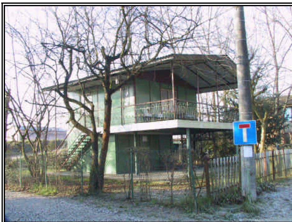
Rilievo fot. n°26