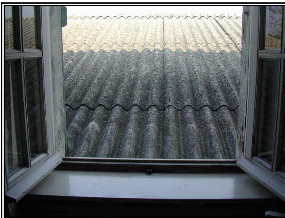
Rilievo fot. n°22