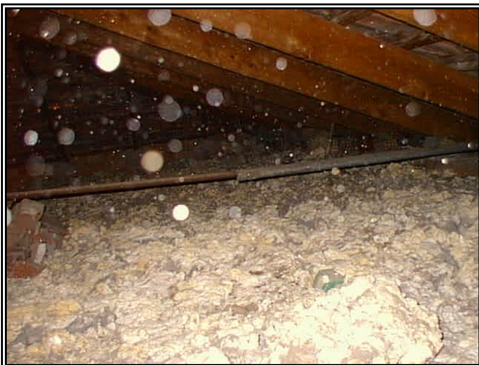
Sottotetto (l'apertura causa le dispersione delle particelle/fibre)