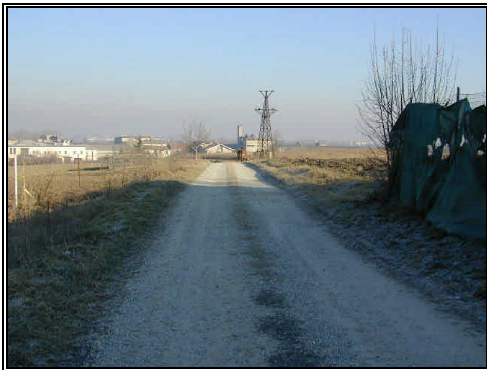
Rilievo fot. n°7