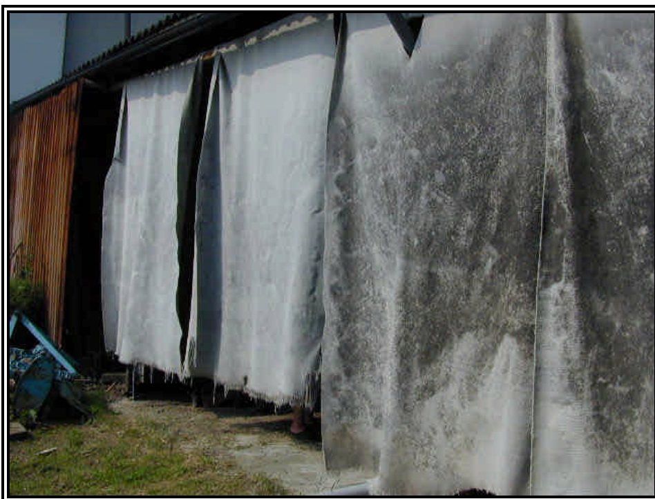
Rilievo fot. n°2