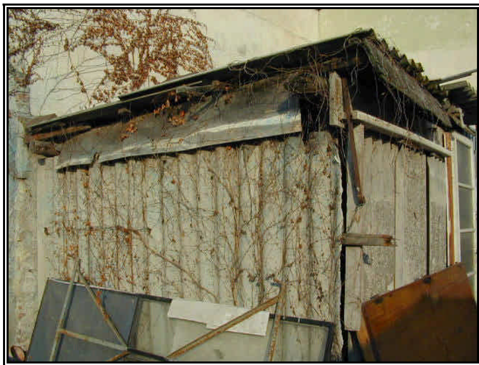
Rilievo fot. n°24

Direzione regionale Tutela e Risanamento Ambientale, Programmazione Gestione Rifiuti Via principe Amedeo 17 – 10123 Torino