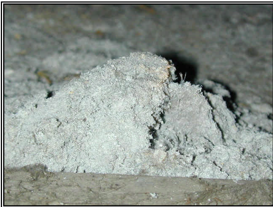
Rilievo fot. n°11