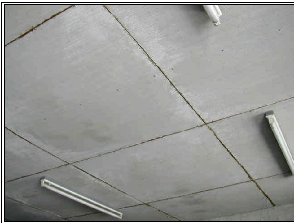
Rilievo fot. n°15