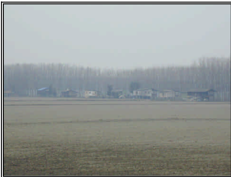
Rilievo fot. n°27