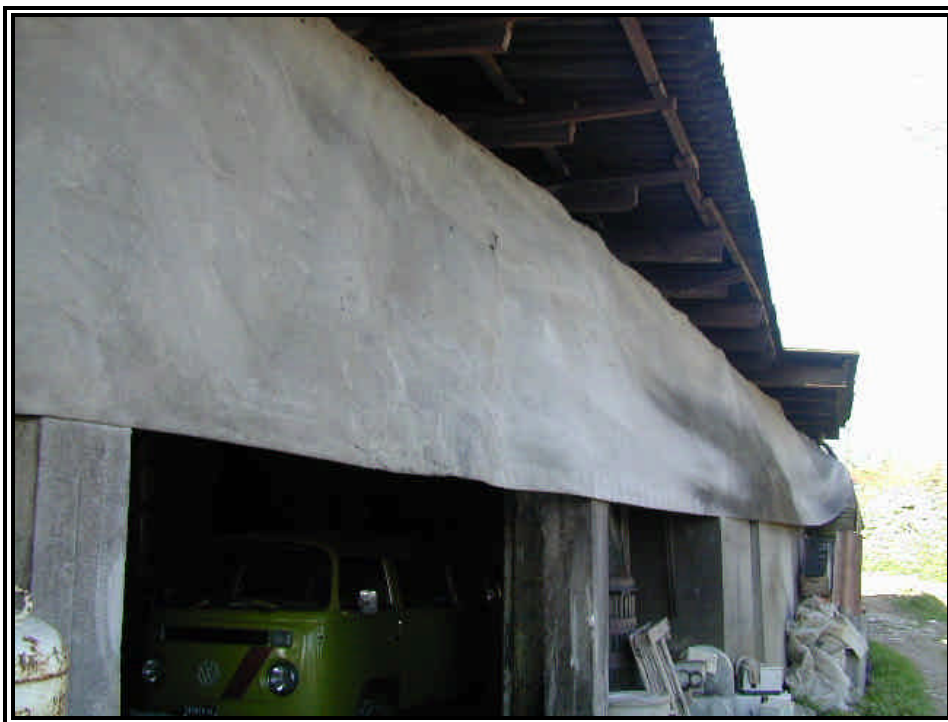
Rilievo fot. n°1