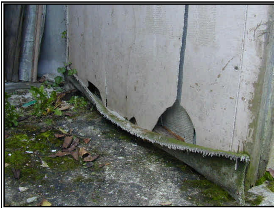
Rilievo fot. n°17