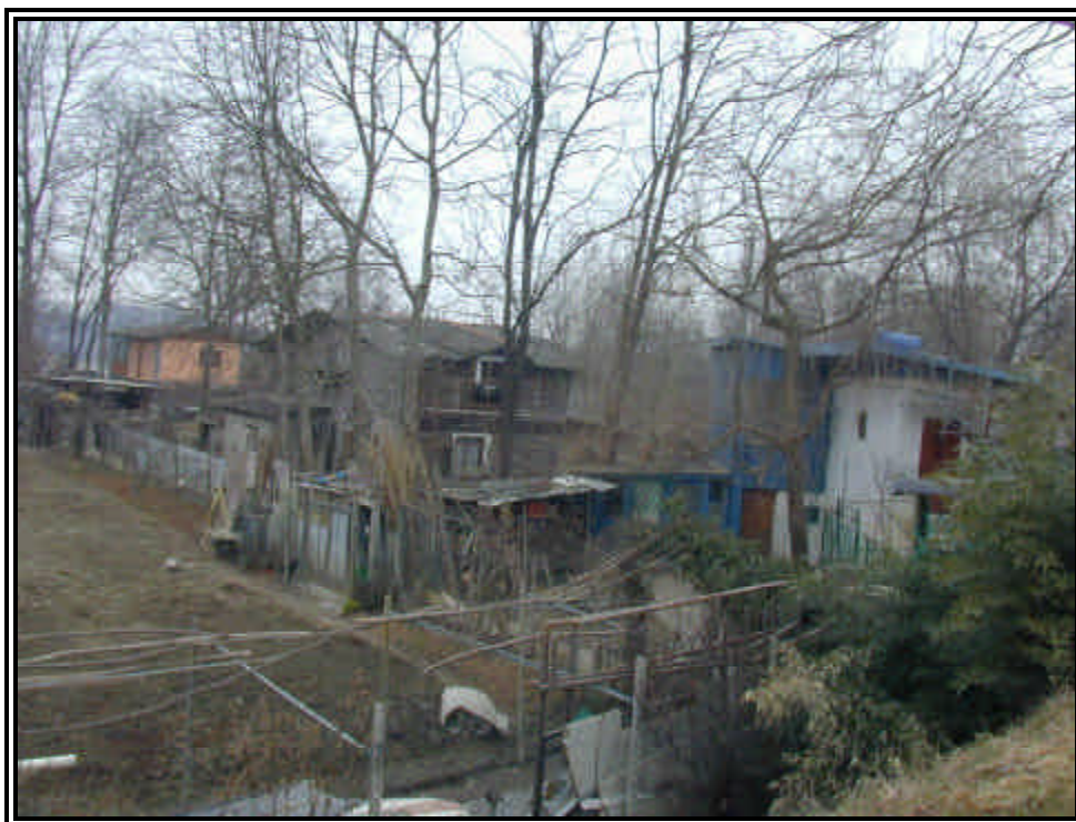
Rilievo fot. n°28