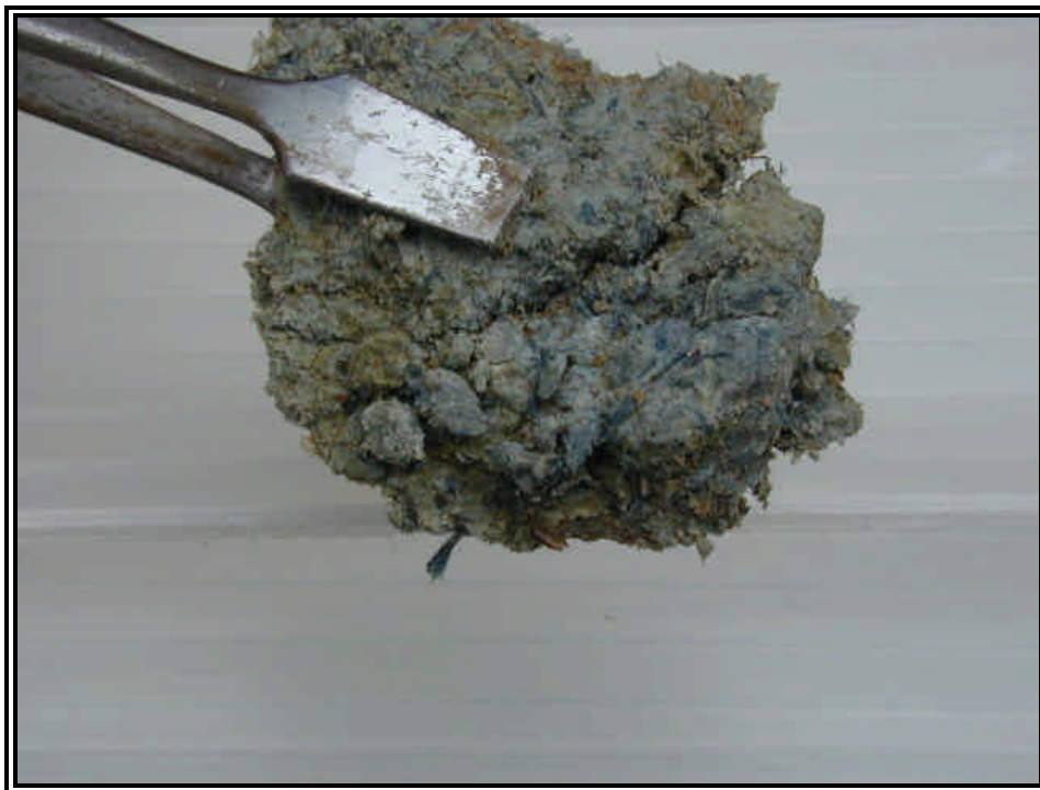
Rilievo fot. n°9