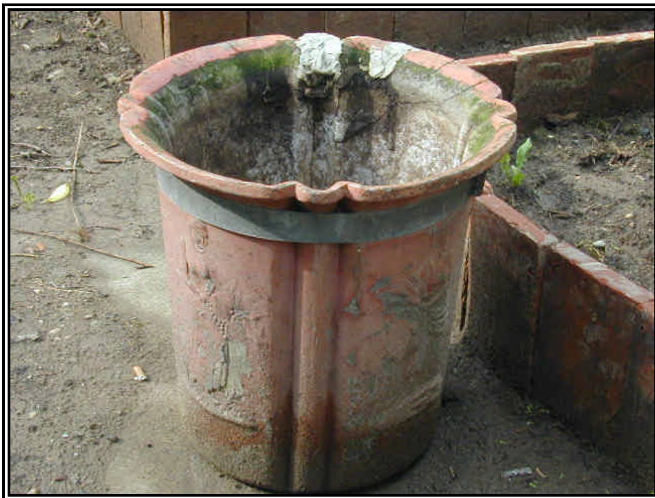
Rilievo fot. n°19