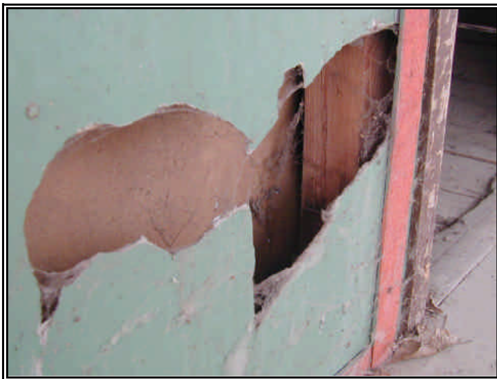
Rilievo fot. n°29