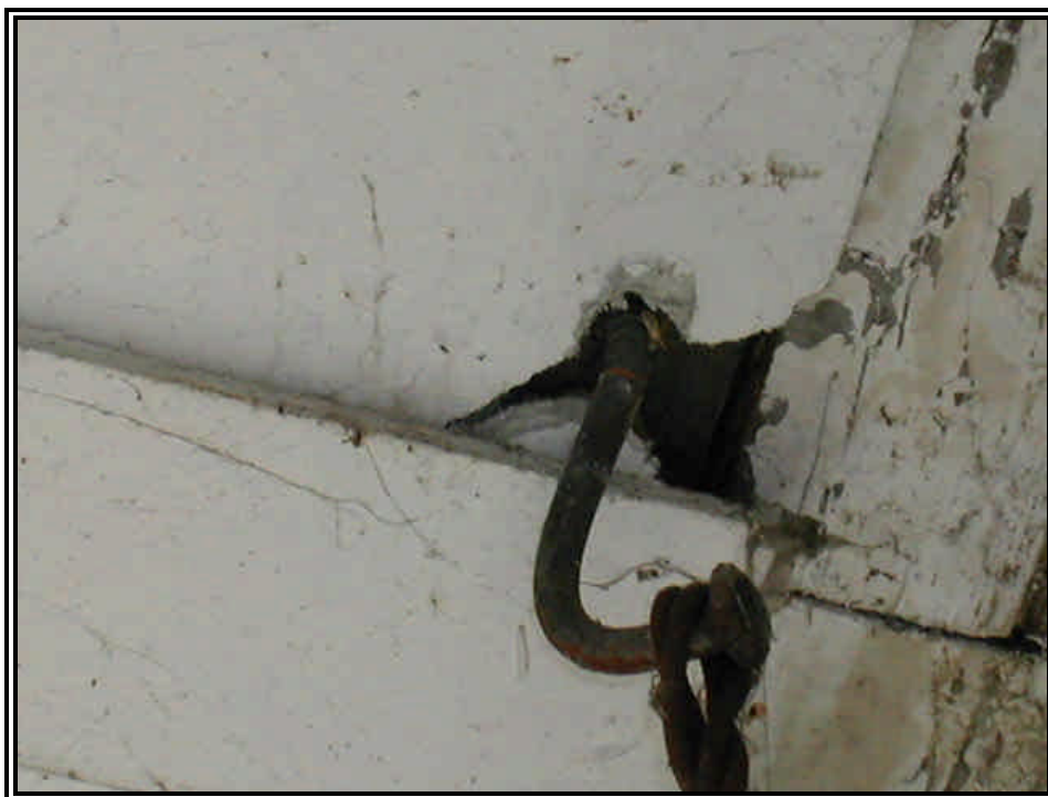
Rilievo fot. n°14

Direzione regionale Tutela e Risanamento Ambientale, Programmazione Gestione Rifiuti Via principe Amedeo 17 – 10123 Torino