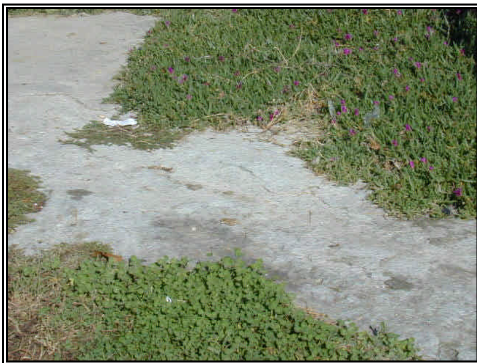
Rilievo fot. n°10

Direzione regionale Tutela e Risanamento Ambientale, Programmazione Gestione Rifiuti Via principe Amedeo 17 – 10123 Torino