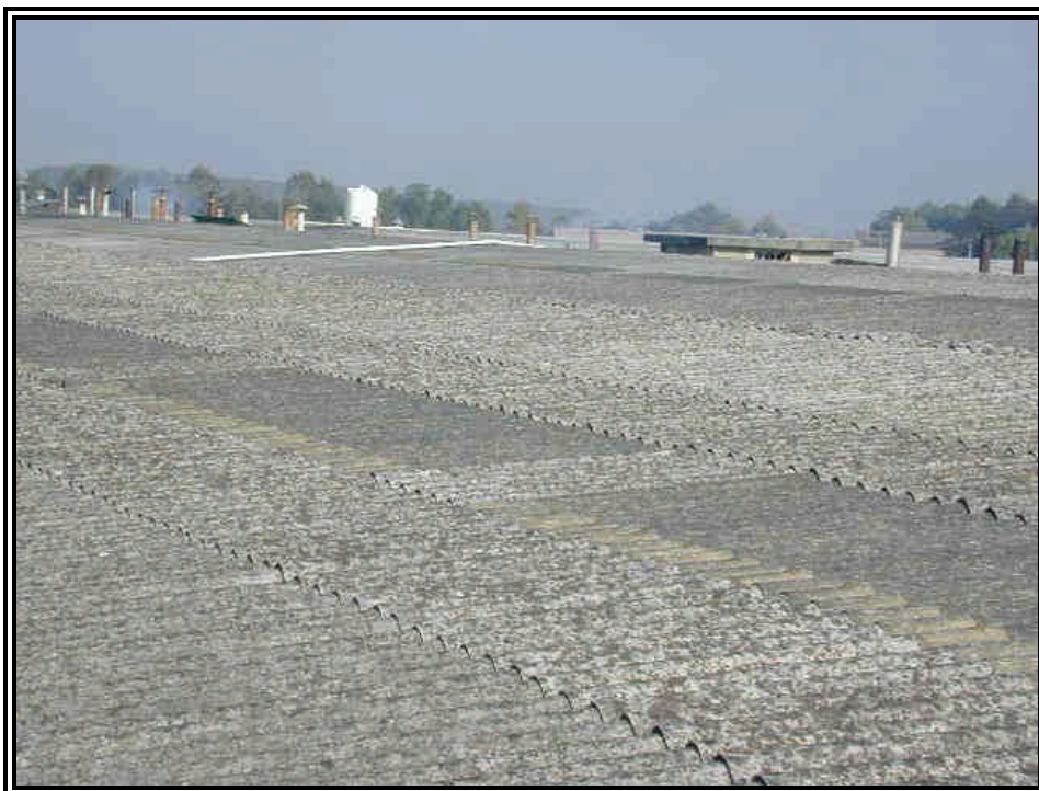
Direzione regionale Tutela e Risanamento Ambientale, Programmazione Gestione Rifiuti Via principe Amedeo 17 – 10123 Torino