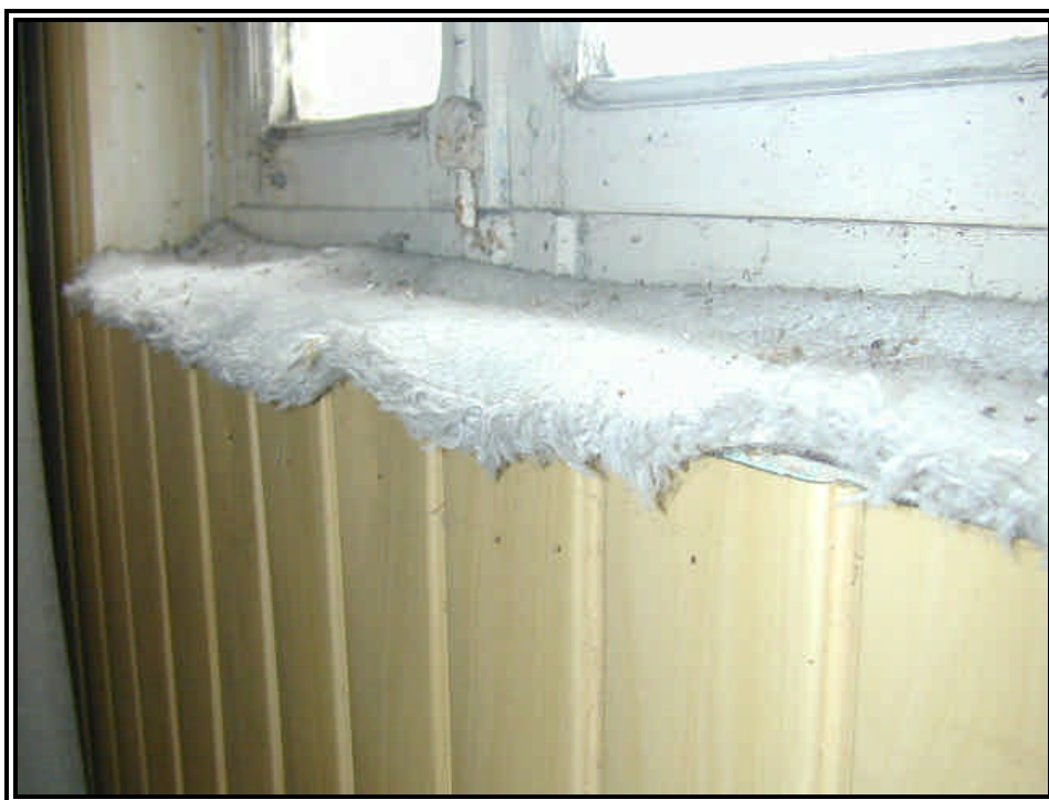
Rilievo fot. n°4

Direzione regionale Tutela e Risanamento Ambientale, Programmazione Gestione Rifiuti Via principe Amedeo 17 – 10123 Torino