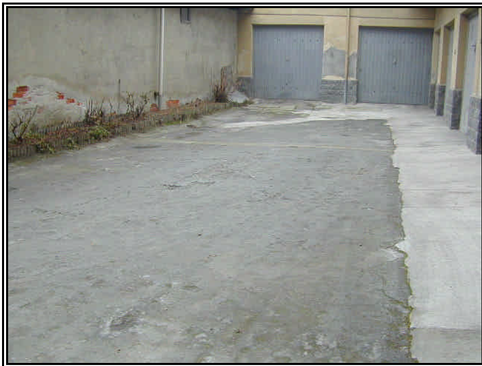
Rilievo fot. n°5