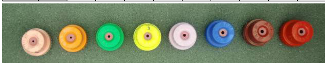
Tabella 5 – Esempio di tabella portata (l/min) -pressione (bar) per gli ugelli classificati secondo la norma ISO