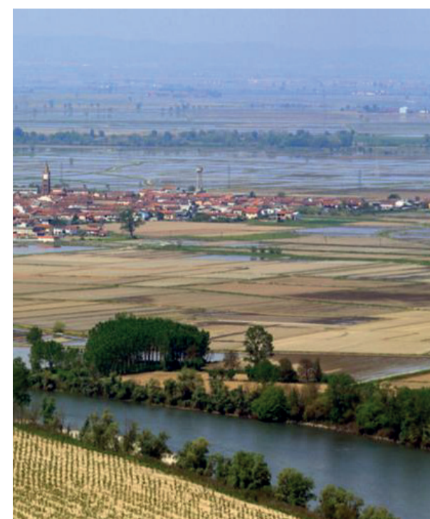
La Regione Piemonte chiede di tutelare la produzione di riso