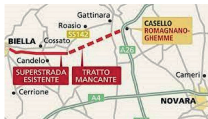
Il tracciato della Pedemontana Piemontese e, sotto, l'area del campo base di Ghislarengo (Vc), che ha ospitato l'inaugurazione del cantiere

https://www.regione.piemonte.it/web/pinforma/notizie/al-via-lavori-costruzione-della-pedemontana-piemontese