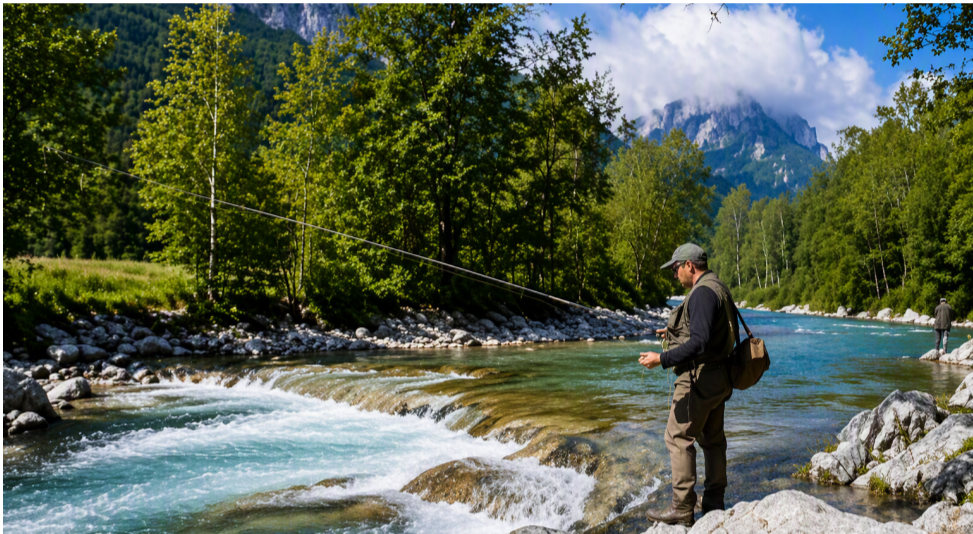
Individuati i tratti del reticolo idrografico cuneese da parte della Provincia

Dopo le valutazioni tecniche espresse dal Snpa, il Sistema Nazionale per la Protezione dell'Ambiente Pesca, le immissioni di trota iridea I tratti interessati del reticolo idrografico sono stati individuati dalla Provincia di Cuneo