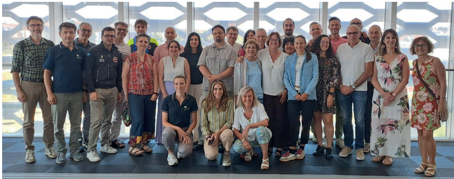
Oltre a Regione Piemonte, capofila, al Comitato hanno partecipato i 9 partner italiani e francesi: Regione Autonoma Valle d'Aosta, Regione Liguria, Fondazione Cima, Fondazione Montagna Sicura, Fondazione Links, Arpa Piemonte, Service Départemental d'Incendie et de Secours des Alpes-de-Haute-Provence, Service Départemental d'Incendie et de Secours des Hautes-Alpes, ed il Cpie

Rischi Capitalizzazione Resilienza: primo Comitato di Pilotaggio con i partner italiani e francesi