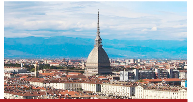
La Mole Antonelliana