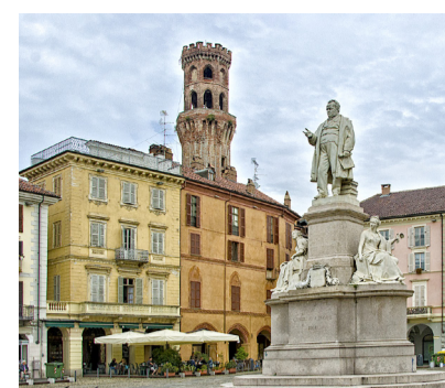
Piazza Cavour la piazza centrale di Vercelli