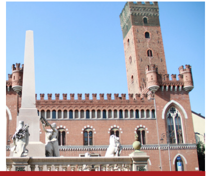
La Torre Comentina nel centro storico di Asti