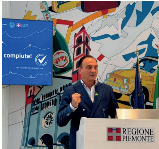
Il presidente della Regione Piemonte, Alberto Cirio, ha illustrato gli obiettivi raggiunti in Piemonte con i progetti finanziati dal Pnrr

La Regione Piemonte ha rispettato tutte le scadenze fissate dall'Unione Europea