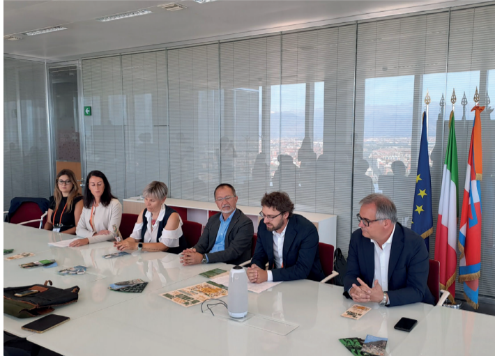
Momenti della presentazione della trentesima edizione della Mostra Nazionale della Toma di Lanzo e dei formaggi di alpeggio, al Grattacielo Piemonte