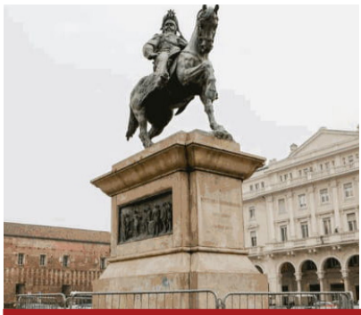
Statua equestre di Vittorio Emanuele II in piazza Mariri