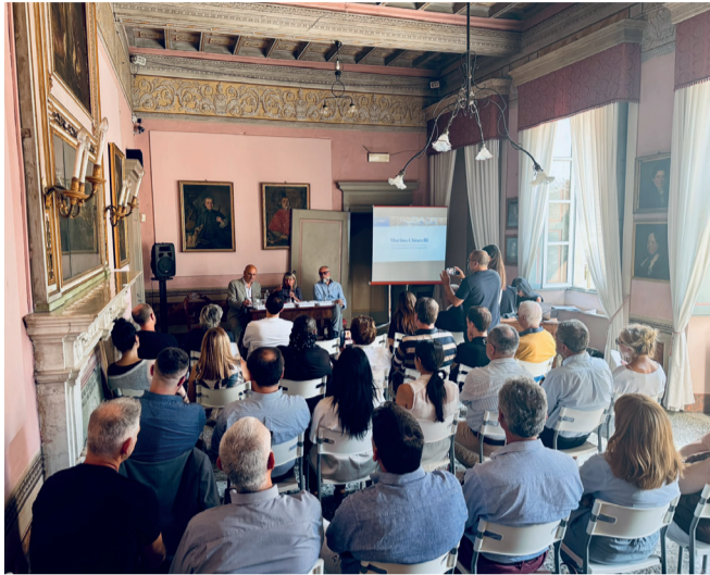
Momento della presentazione delle attività della Film Commission Torino Piemonte, svoltasi ad Orta San Giulio (No)

Sviluppare un sistema virtuoso per l'attrazione e la realizzazione di produzioni audiovisive attraverso il coinvolgimento attivo del territorio: questo l'obiettivo della Rete regionale di Film Commission Torino Piemonte, che dalla sua nascita nel 2017 è arrivata a unire 174 comuni in tutte le province piemontesi. Un network in continua espansione che nel solo 2026 ha già registrato 10 nuove adesioni, tra cui la Città Metropolitana di Torino e la Provincia di Cuneo. Un modello di successo che dopo