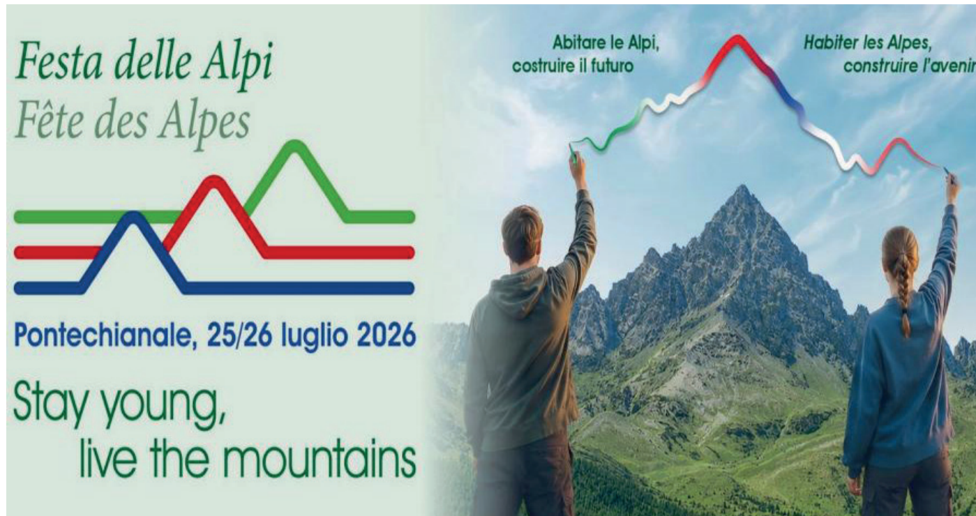
La locandina della Festa delle Alpi, momenti della presentazione del programma e, in basso a destra, panorama di Pontechianale

Sabato 25 e domenica 26 luglio, con lo slogan "Abitare le Alpi, costruire il futuro"