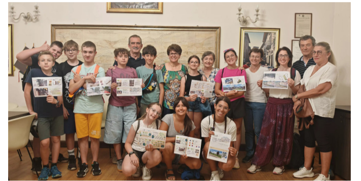
L'incontro tra gli studenti della Consulta Ambientale ed il Comune

Con la partecipazione di 6 classi italiane e francesi