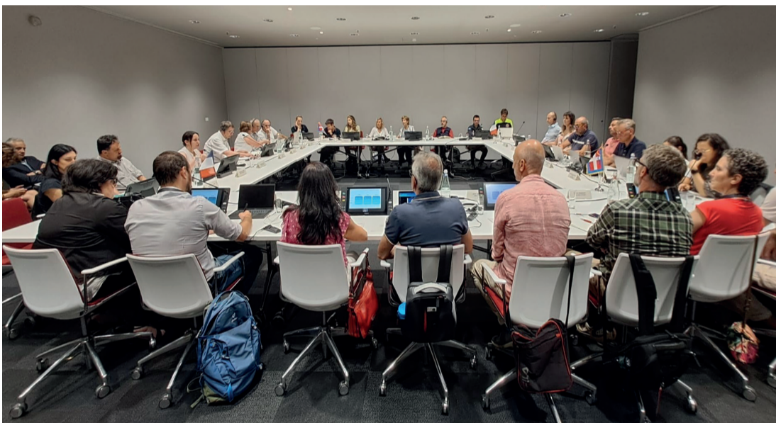
Un momento dell'incontro del Comitato di Pilotaggio, la centro Congressi della Regione Piemonte. Sotto, il logo Alcotra

Diverse sono le attività previste: incontri informativi nelle scuole per aumentare la consapevolezza dei giovani rispetto ai rischi naturali (per esempio frane, valanghe, inondazioni, incendi boschivi), anche attraverso l'innovazione tecnologica; lo sviluppo di scenari di realtà virtuale attraverso una Piattaforma transfrontaliera per la comunicazione digitale dei rischi, con simulazioni di realtà virtuale accessibile a tutta la popolazione; un'attività di comunicazione del rischio da parte degli enti locali, anche con percorsi di formazione per amministratori e tecnici; l'aggiornamento del geoportale transfrontaliero dei rischi con la creazione di geo-itinerari che consentiranno di esplorare il territorio individuando i principali