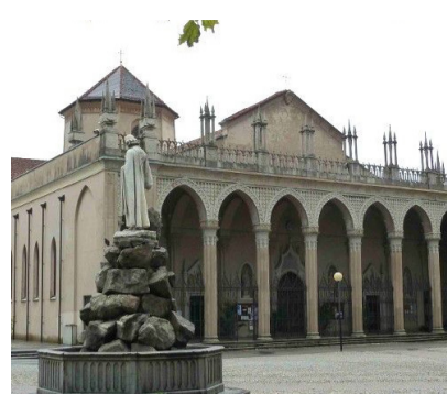
Duomo Il tempio dedicato a S. Maria Maggiore e S. Stefano