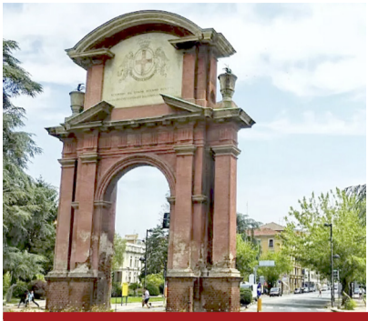
Simbolo della città raggiungibile da Piazza della Libertà: l'Arco di Trionfo