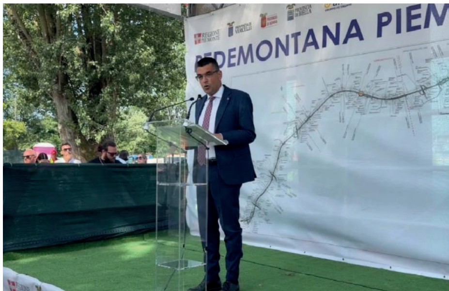
L'intervento dell'assessore regionale alle Infrastrutture strategiche e Logistica, Enrico Bussalino

«L'avvio dei lavori della Pedemontana Piemontese – hanno dichiarato il presidente della Regione Piemonte Alberto Cirio e l'assessore regionale alle Infrastrutture strategiche e Logistica Enrico Bussalino – rappresenta un momento storico per il nostro territorio. Dopo anni di attesa, questa infrastruttura entra finalmente nella fase realizzativa, confermando la volontà del Governo e in particolare del ministro delle