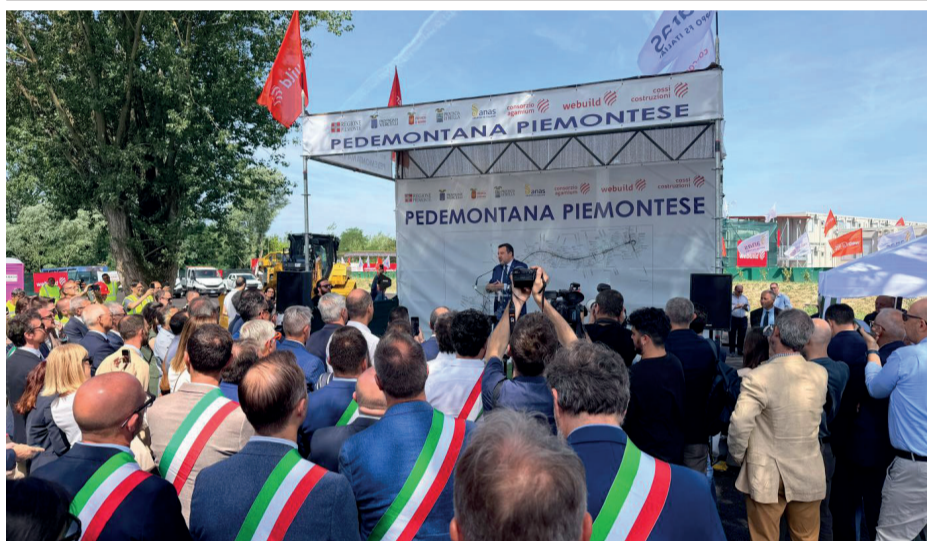
All'insediamento del cantiere il ministro Matteo Salvini e molte autorità locali. Sotto, il tracciato