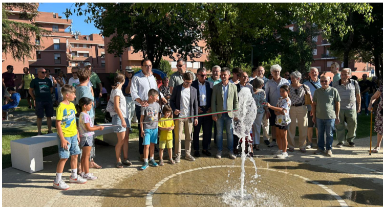
L'inaugurazione dell'area verde di via Aldo Moro ad Alba

È stata inaugurata venerdì 3 luglio ad Alba la rinnovata area verde di via Aldo Moro, un intervento di riqualificazione urbana che restituisce alla città uno spazio completamente riqualificato all'insegna della sostenibilità e dell'inclusione. L'opera ha interessato una profonda trasformazione dell'area attraverso un'attenta modellazione del terreno, studiata per creare profondità prospettica, movimento e una fruizione armoniosa