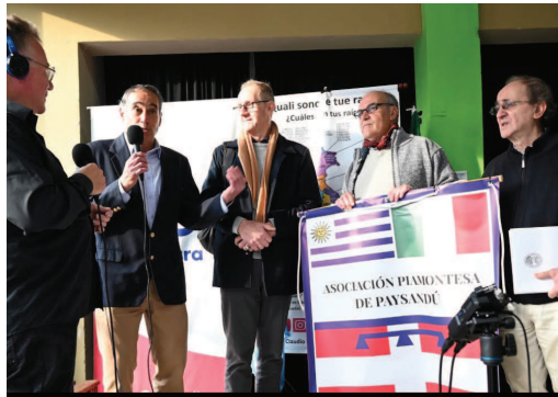
Momenti dell'incontro tra i piemontesi d'Argentina e dell'Uruguay e, in basso, l'esibizione della corale "Vecchie canzoni, giovani cuori"