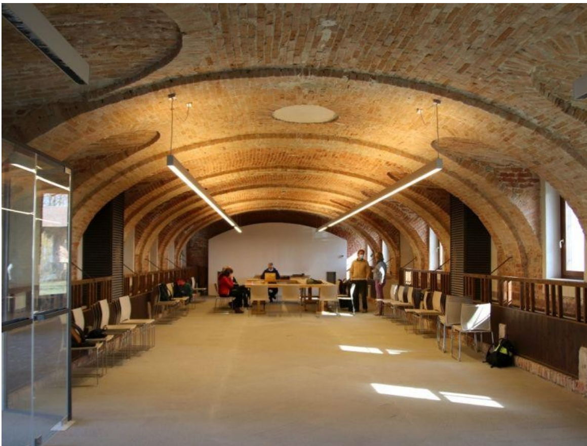
(sala conferenze Sede operativa di Pobietto a Morano sul Po)