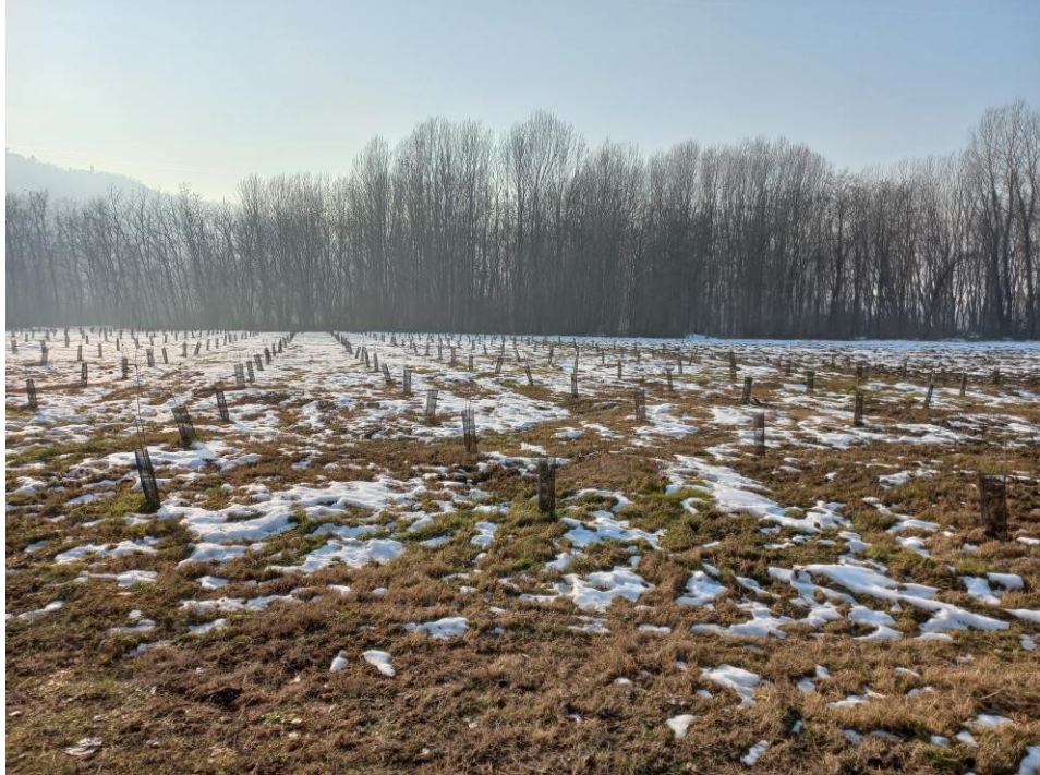
(progetto foresta condivisa del Po piemontese)