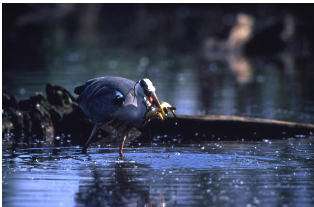
(Airone cenerino - foto M. Libra)