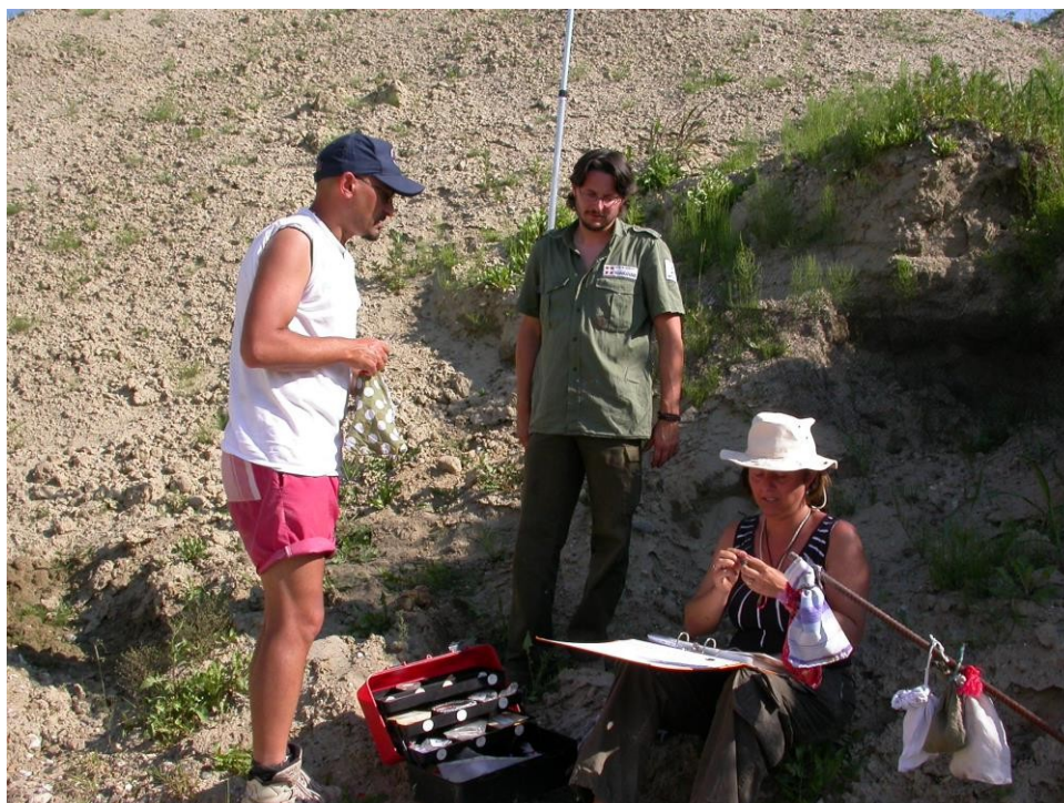
(Inanellamento Topini presso cava Safi)