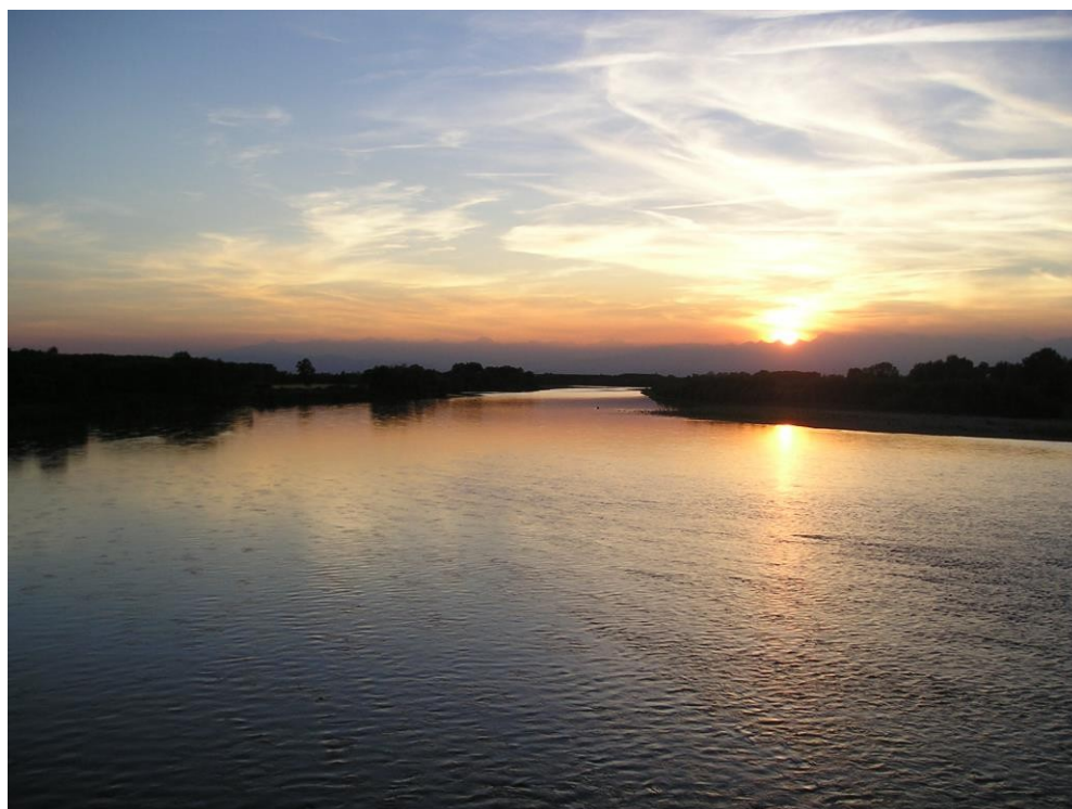
(Il Po visto dal ponte di Crescentino)

supporto alla segreteria tecnica della Riserva MAB per il reperimento delle risorse economiche necessarie ad avviare il processo di candidatura.