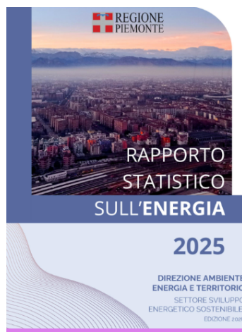
Rapporto Statistico sull'Energia