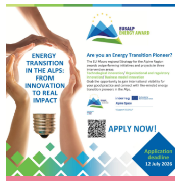
EUSALP Energy Award