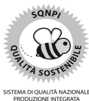
Figura 1.2. Logo Sistema di Qualità Nazionale Produzione Integrata