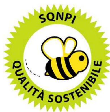
Figura 1: Logo del marchio Produzione Integrata previsto dal Sistema di Qualità Nazionale

SISTEMA DI QUALITÀ NAZIONALE PRODUZIONE INTEGRATA