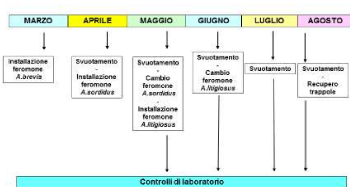
Tabella 4 – Monitoraggio elateridi adulti mediante trappole a feromoni - Calendario degli interventi previsti

Nel caso sia attiva una rete di monitoraggio a carattere comprensoriale, l'azienda vi si potrà inserire posizionando trappole, nei limiti del possibile, secondo una rete a maglia regolare, i cui nodi siano rappresentati dalle aziende.