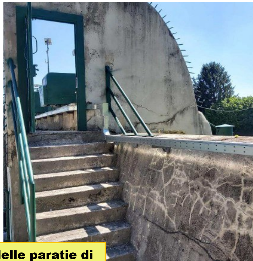
Vista esterna delle paratie di controllo delle portate