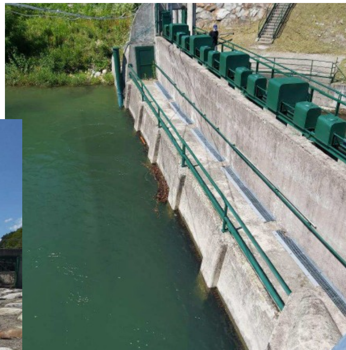
Vista esterna delle paratie di deflusso sul torrente Orco