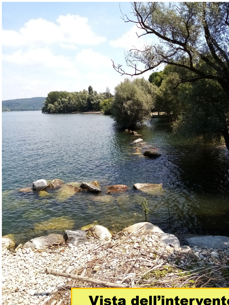
Vista dell'intervento di rispristino della naturalità dalla zona del lido di Arona