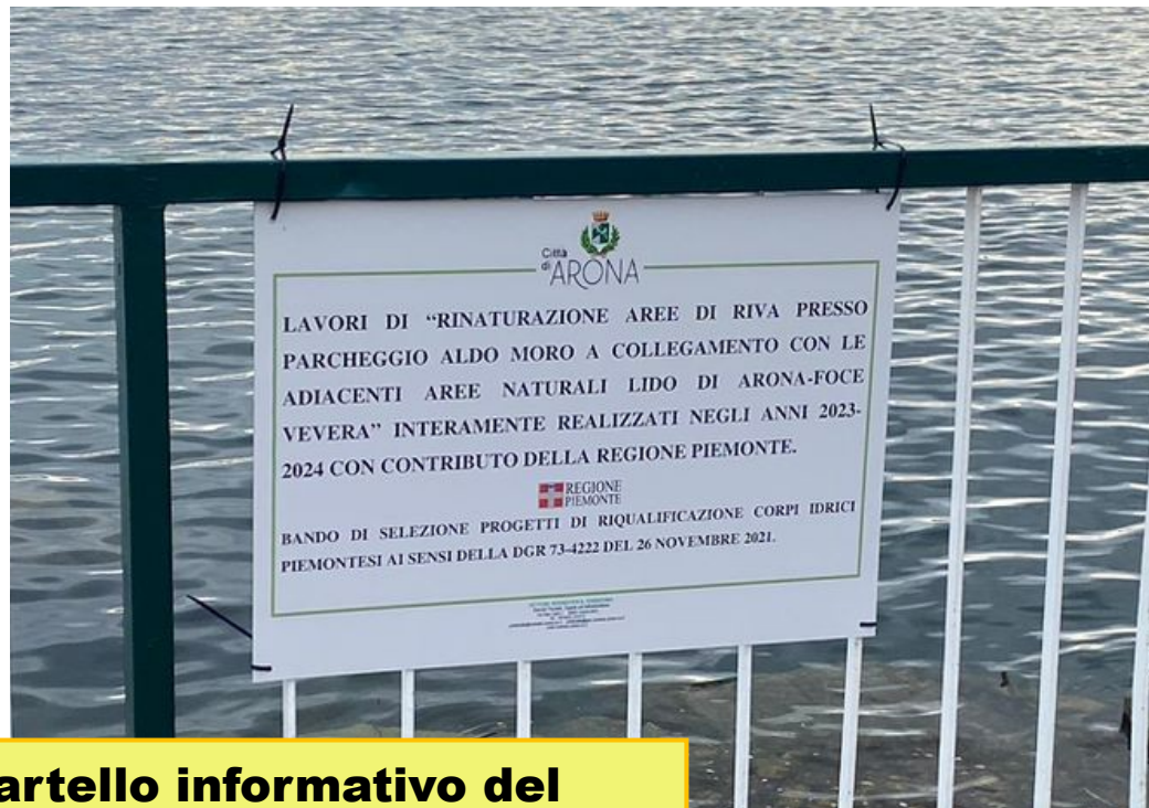
Cartello informativo del progetto di riqualificazione