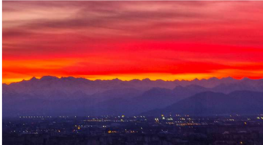
Un tramonto sulle Alpi visto dall'ultimo piano del Grattacielo della Regione Piemonte a Torino

Il 2023 è stato un anno eccezionale per la qualità dell'aria in Piemonte, con le concentrazioni di inquinanti atmosferici registrate dalle stazioni di monitoraggio regionali che hanno raggiunto i livelli più bassi dall'inizio delle rilevazioni. La strada verso un ambiente più pulito è ancora lunga, ma i passi avanti sono evidenti e incoraggianti. È quanto emerge dal rapporto "Qualità dell'aria in Italia 2023", presentato a Torino il 15 marzo dal Sistema nazionale per la protezione dell'ambiente Snpa – costituito dall'Istituto superiore per la protezione e la ricerca ambientale (Ispra) e dalle Agenzie ambientali di Regioni e Province autonome. Questo miglioramento è attribuibile a diversi fattori meteorologici favorevoli, tra cui l'alto numero di giorni di fohen e una ventilazione superiore alla media, che hanno impedito l'accumulo di inquinanti nonostante una tendenza generale alla riduzione delle precipitazioni. Le misurazioni del particolato fine (pm10 e pm2.5) e del biossido di azoto hanno mostrato un rispetto generalizzato dei limiti annuali stabiliti. In particolare, nessuna stazione ha superato il valore limite per la media annua di pm10 e PM2.5, segnan-