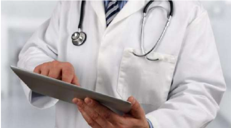
Obiettivo dell'accordo è di abbattere le liste d'attesa in sanità

Osserva Icardi: «L'impegno per l'abbattimento delle liste di attesa è una priorità assoluta per la Sanità regionale, uno sforzo che ha già prodotto notevoli risultati grazie alla collaborazione con le aziende sanitarie, gli erogatori privati, i medici di medicina generale, le associazioni dei pazienti e alle risorse che la Regione ha investito per l'assunzione del personale e per l'ammodernamento e l'adeguamento tecnologico delle strutture e delle apparecchiature sanitarie. Sul piano del metodo, abbiamo ritenuto fondamentale