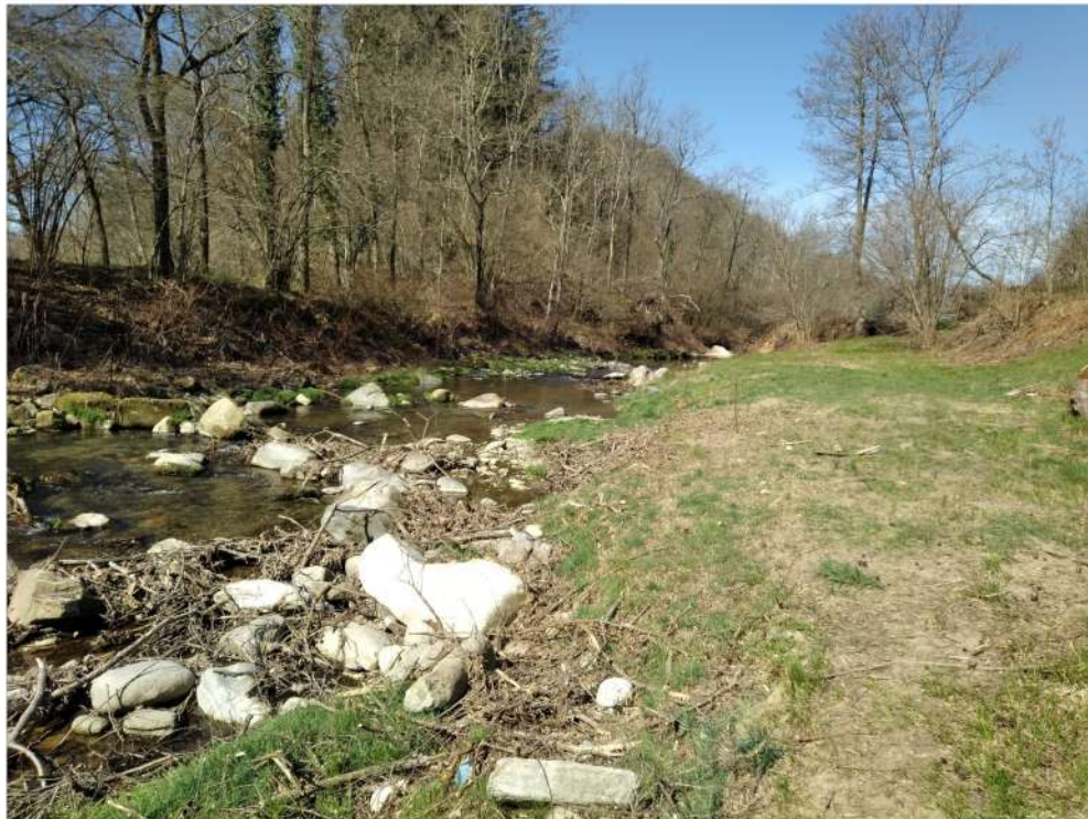
Miasino – zona destinata alla creazione di una pozza con rimodellamento in alveo