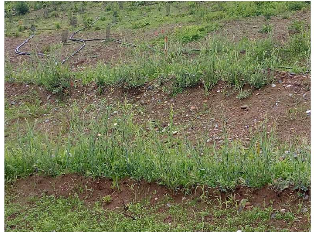
inverdimento con astoni di salice ad attecchimento