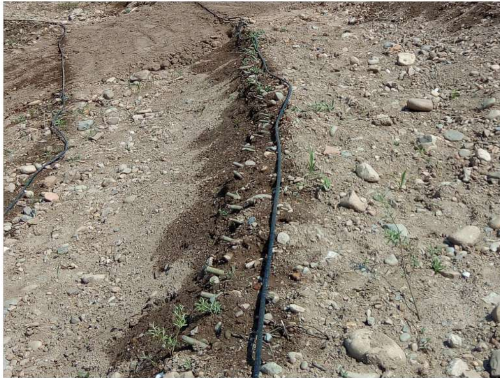
inverdimento con astoni di salice alla messa a dimora