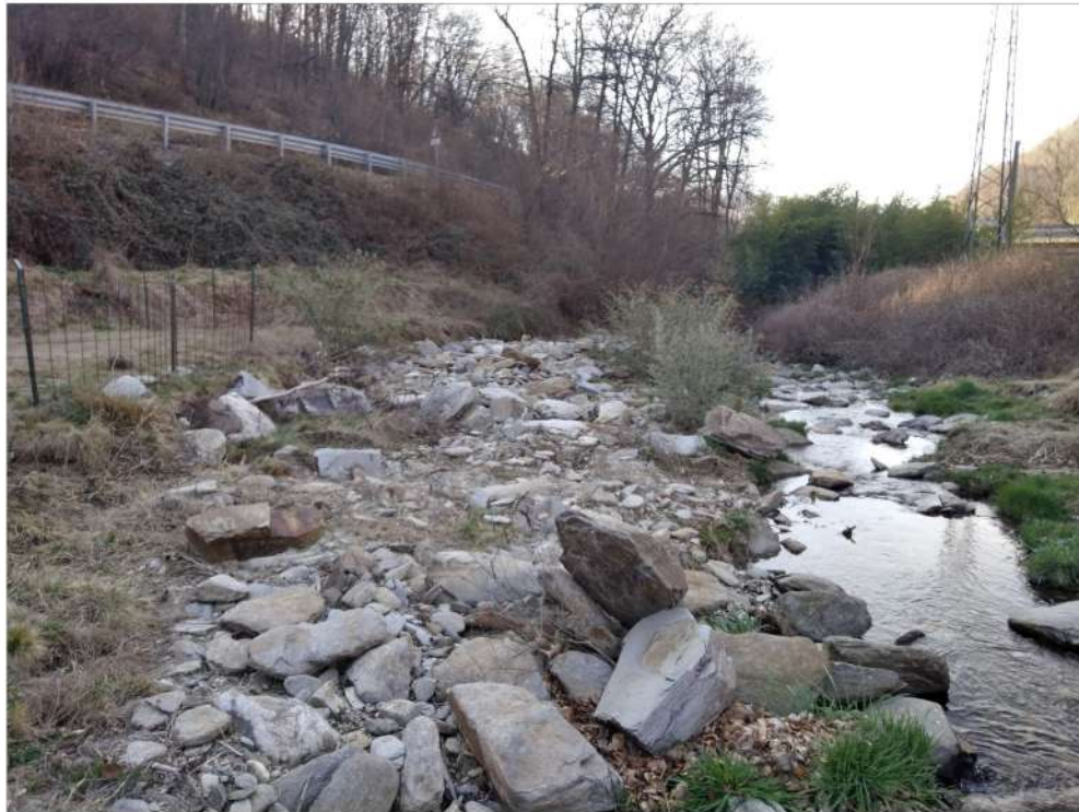
Gignese – sedimenti alluvionali in alveo