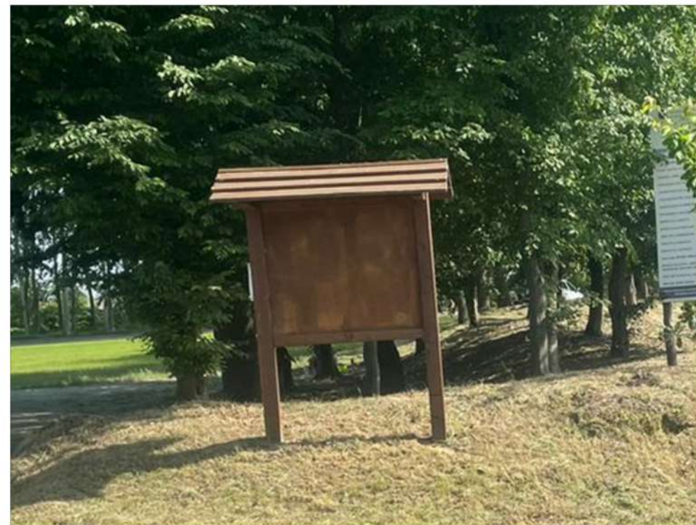
opera accessoria - bacheca