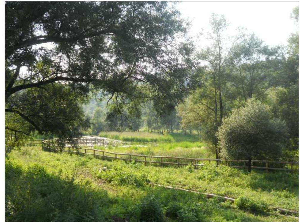
area umida permanente