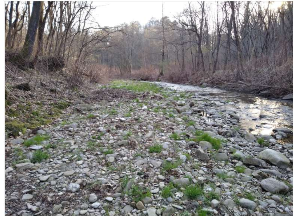
Ameno – ex lanca riempita da depositi alluvionali