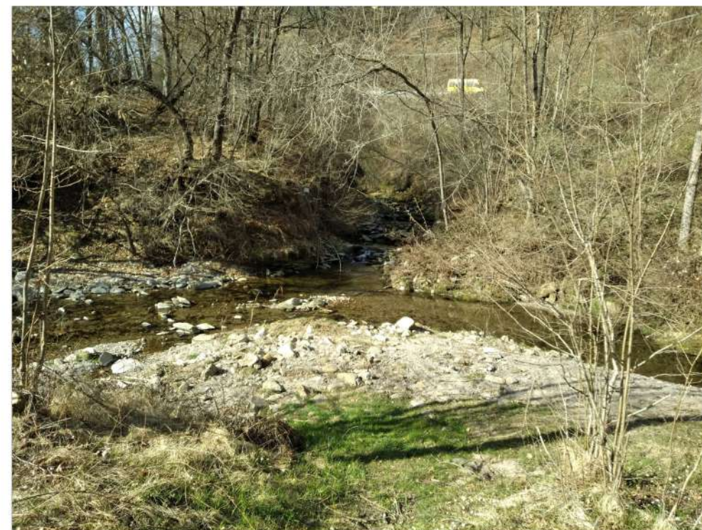
Armeno – zona destinata alla creazione di una pozza con rimodellamento in alveo