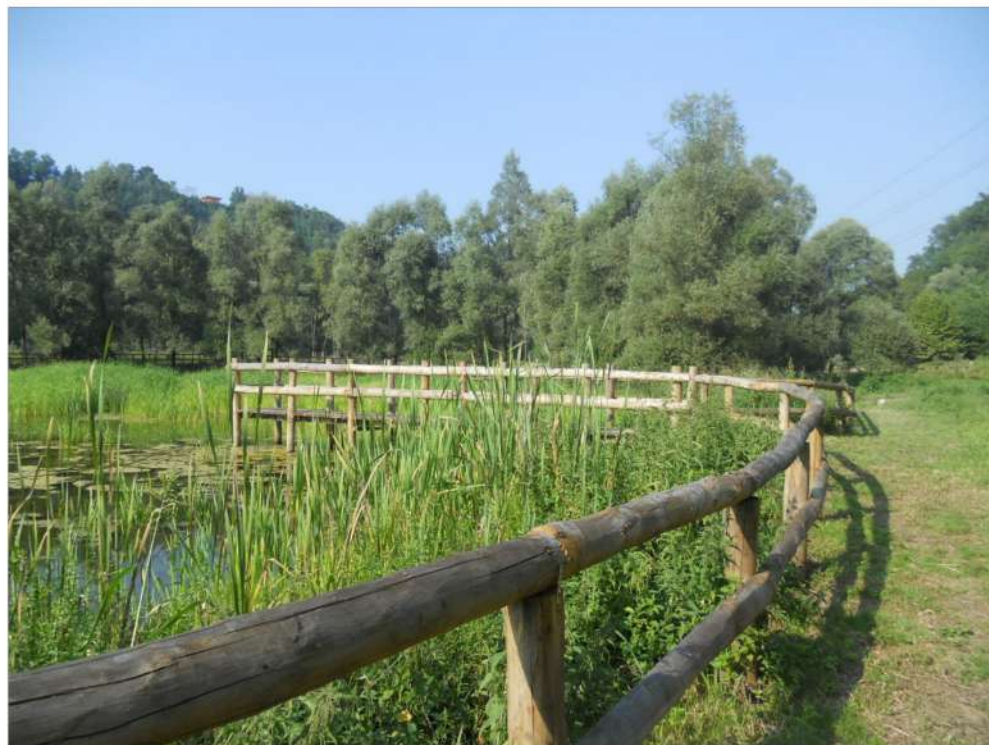
opera accessoria - staccionata