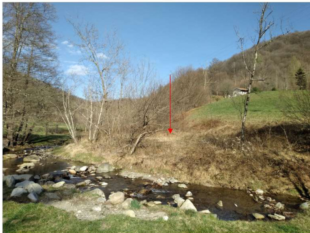
Armeno – zona destinata alla realizzazione di un'area umida