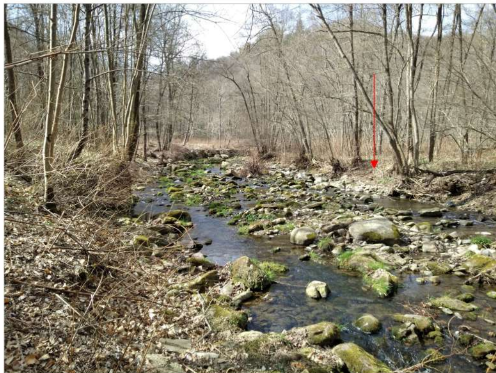
Bolzano Novarese/Ameno – zona destinata a rimodellamento alveo e creazione area umida