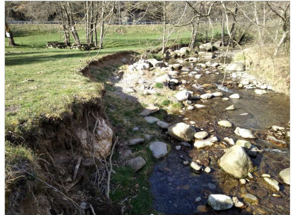
Armeno – sponda in erosione con sedimenti in alveo