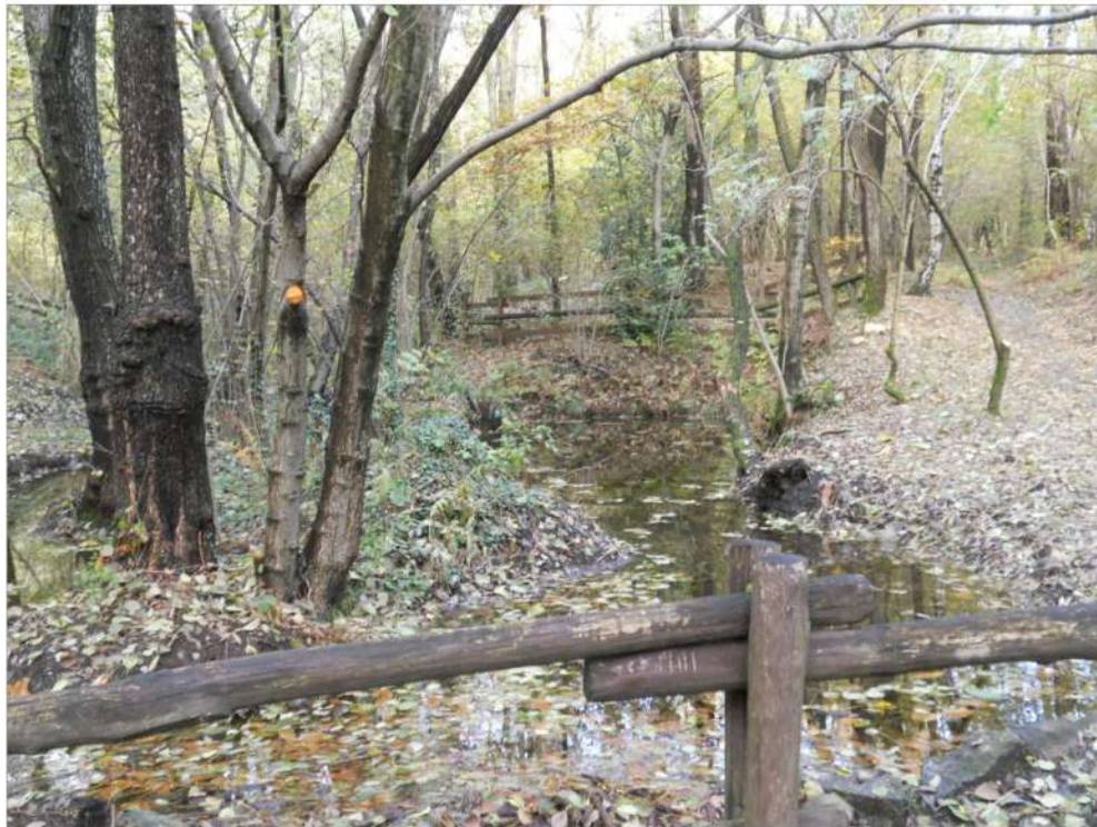
area umida permanente in zona boscata