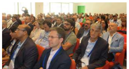
Il saluto del presidente Alberto Cirio ed il folto pubblico intervenuto