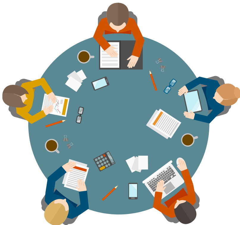
Tavola Rotonda sulle esperienze degli Uffici di prossimità del Piemonte