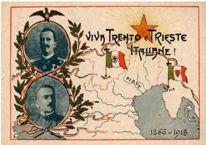
Propaganda italiana de la guerra

fronteras, que no obstante no quedan estables, ( se vuelven a modificar después de la 2da guerra mundial) pero el Reino de Italia festeja, como lo ejemplifica la propaganda, la recuperación de Trieste y Trento que hasta 1914 pertenecían a Austro-Hungría