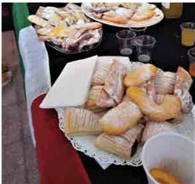
Pastelería típica del Piemonte