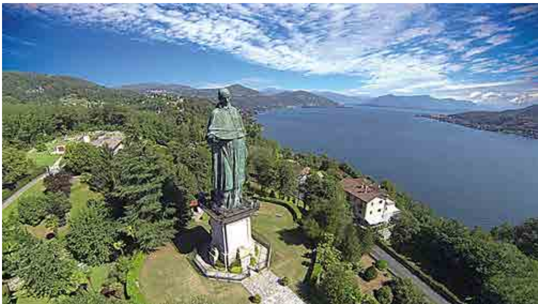
Coloso de San Carlo Borromeo en Arona a orillas del lago Maggiore, Piemonte

Era un noble de alta alcurnia por parte de padre y de madre que pertenecía a la familia Medici, su tío fue el Papa Pío IV . Actuó siempre en favor de los pobres y humildes, sobre todo en la peste que asoló la región en el siglo XVI. Llegó al extremo de transformar en vestidos para los necesitados, los toldos y doseles de colores que solían colgarse desde el palacio episcopal hasta la catedral, durante las procesiones.