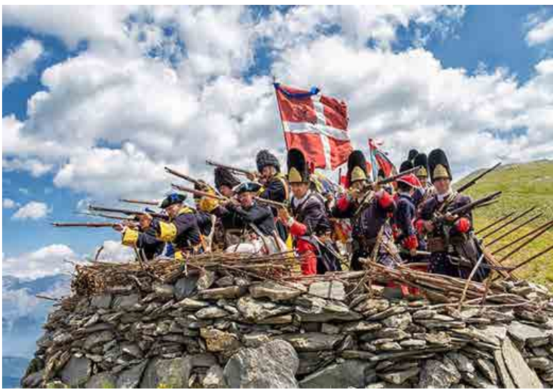
Representación alegórica de la batalla de Assietta

las 16:30 comenzaron a atacar las tropas francesas con sus aliados para tomar la colina. Ante el avance de las poderosas tropas enemigas, el general Bricherasio viendo el peligro, le ordenó al Conte di San Sebastiano que se retire del frente, pero éste no le hizo caso, no obedeció la orden y resistió con heroísmo en la meseta. Las tácticas empleadas por los franceses resultaron ser totalmente infructuosas. El general francés Bellisle, viendo que sus soldados no podían romper la resistencia de las tropas saboyanas, arrancó la bandera de las manos de su propio obispo y se lanzó a otro asalto, esperando con este ejemplo arrastrar a los suyos. Esta hazaña, sin embargo, fue fatal, fue herido por una bala disparada por un soldado piemontés y poco después muerto por la bayoneta de otro soldado piemontés. La actitud del Conte di San Sebastiano y su pequeña tropa de no moverse de la