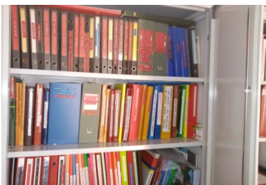
Parte dell'Archivio Storico Museale dell'APM