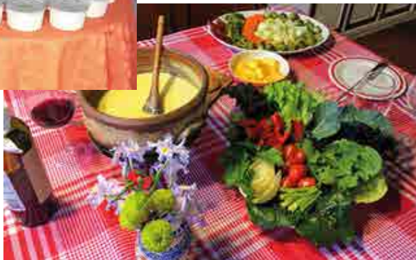
una mesa típica para comer bagna cauda