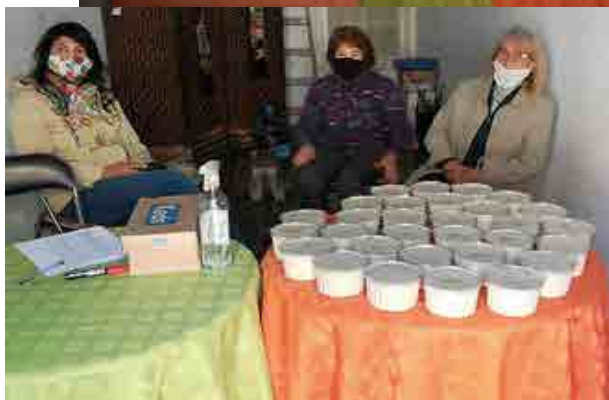
Nuestras socias colaborando