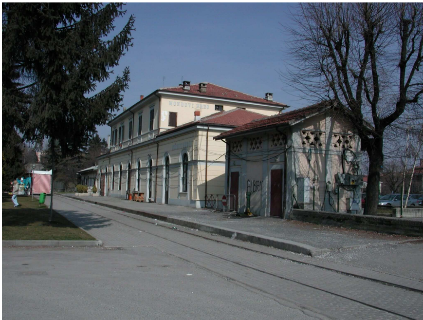
FIGURA 8: Fabbricato Viaggiatori e fabbricato WC

Nella parte alta dei prospetti sono ricavate delle piccole aperture per l'illuminazione e l'aerazione dei W.C.