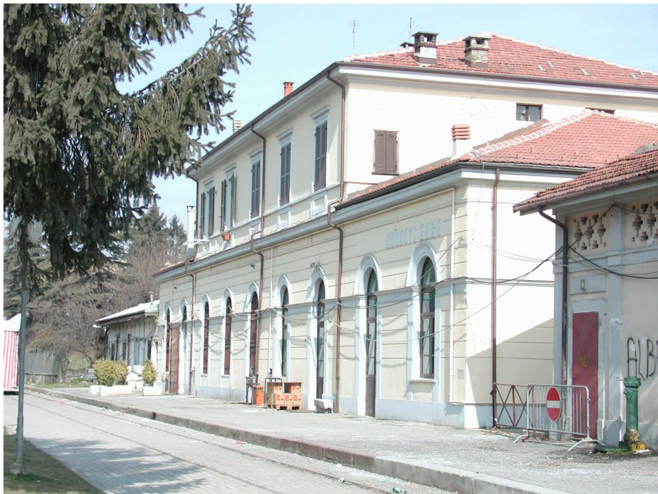
FIGURA 7: Fabbricato Viaggiatori fronte binari e magazzino

Ad un'estremità della stazione è addossato un basso fabbricato, presumibilmente un magazzino di epoca posteriore a quella del fabbricato viaggiatori. Il manufatto si eleva per un solo piano fuori terra. La struttura portante è in travi e pilastri secondo il sistema "Hannebique". I tamponamenti, leggermente arretrati, sono in laterizi. La copertura, a due falde con orditura lignea, è realizzata in lastre ondulate.