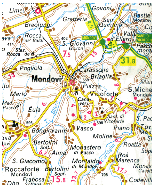
La mappa del tracciato

Oltrepassata la stazione di Mondovì Breo, oggi ristrutturata ed ospitante alcune attività commerciali, il binario passa immediatamente sotto un cavalcavia, imbocca altre tre brevi gallerie (fra la prima e la seconda passa sotto