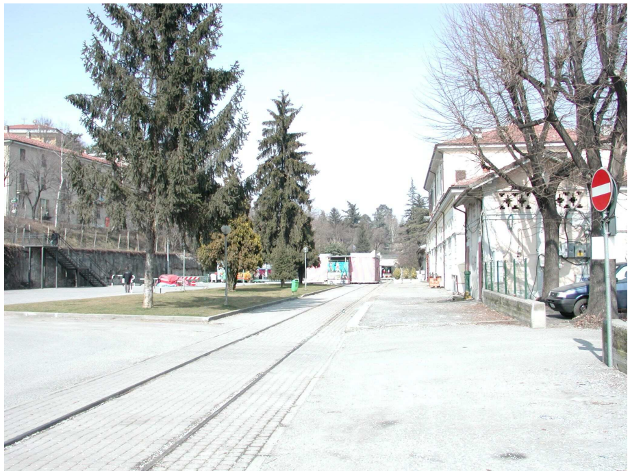
FIGURA 6: ex piazzale riattato a parcheggio pubblico

una cornice piana di colore grigio chiaro. Al piano superiore i serramenti hanno delle persiane in legno. I caratteri tipologici ed architettonici richiamano la stazione di Bra.