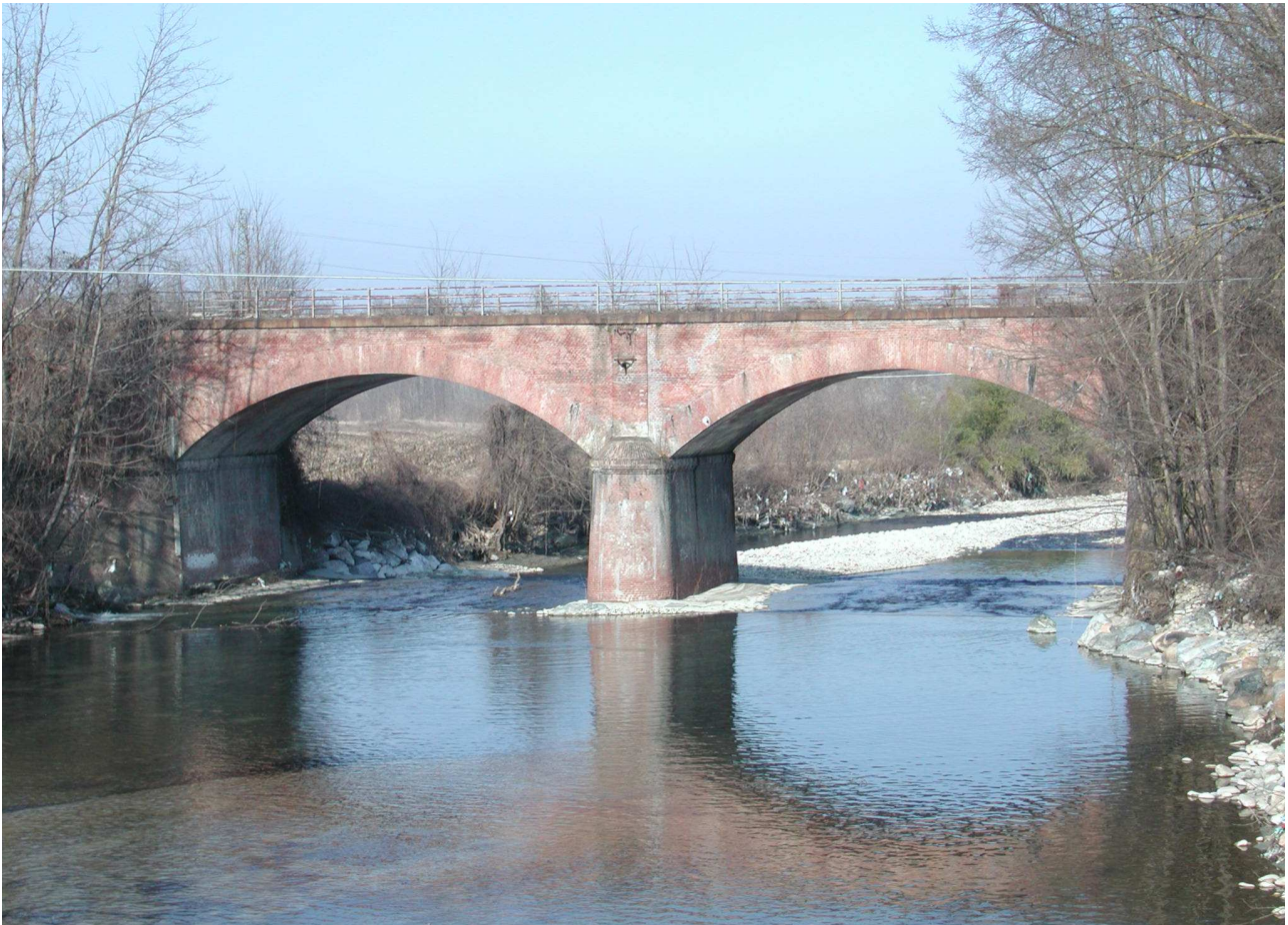
FIGURE 15-16: Ponte inutilizzato sul torrente Ellero al Km 1+254,62, a due archi di m. 18,76 cadauno, in muratura di laterizi, di proprietà F.S.