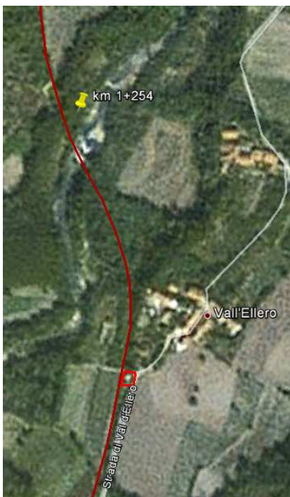
FIGURA 17: Comune di Bastia Mondovì: fine linea