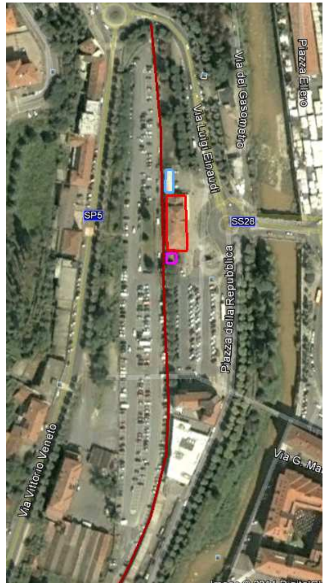
FIGURA 4: Aree Stazione Mondovì-Breo