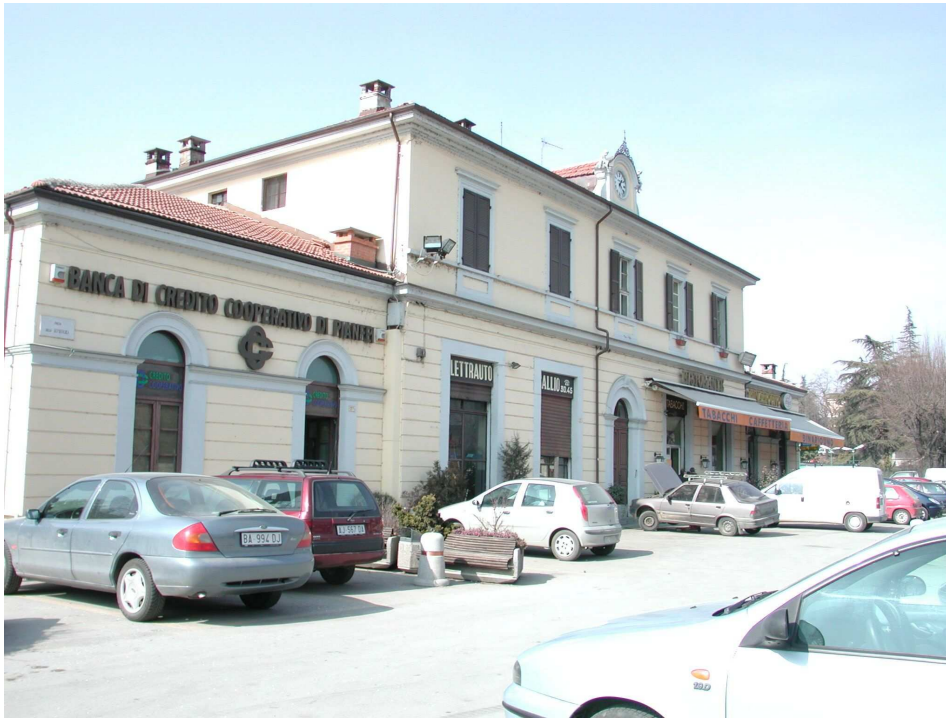
FIGURA 5: Fabbricato Viaggiatori fronte strada

L'orditura è in legno ed il manto in tegole marsigliesi. Nella parte alta del fabbricato principale c'è un timpano con un orologio. Il fabbricato è stato oggetto di un intervento di ristrutturazione e/o manutenzione: le condizioni di conservazione sono molto buone rispetto a fabbricati analoghi e di medesimo periodo. Le facciate sono intonacate con un colore giallo paglierino.