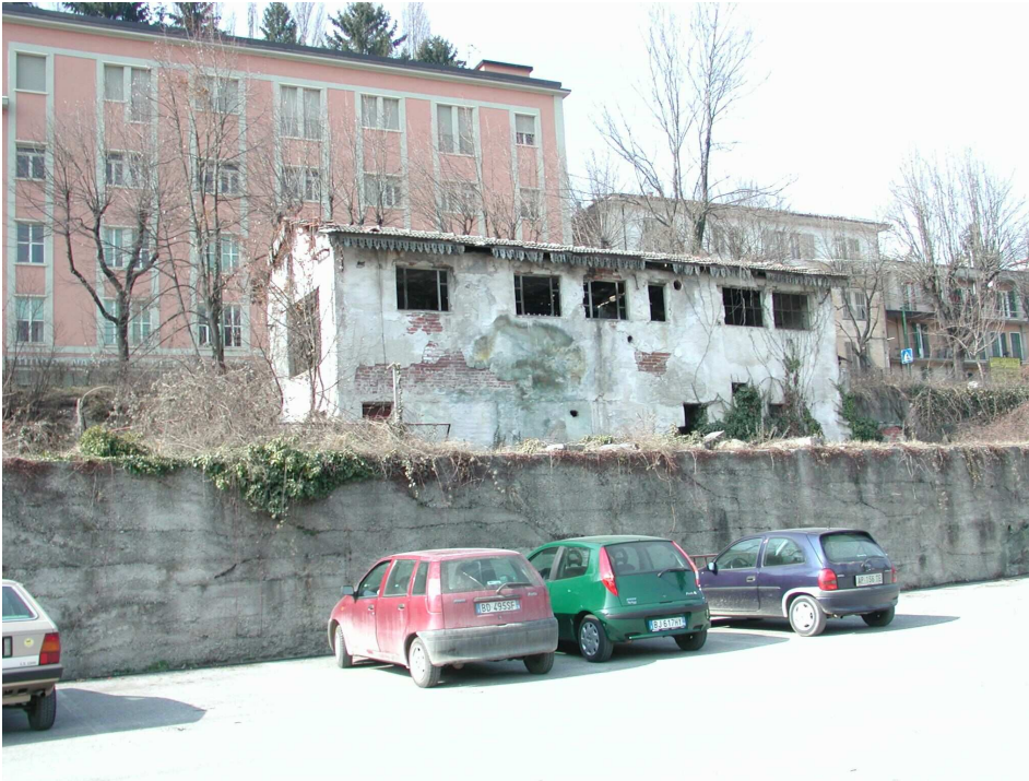
FIGURA 9: Fabbricato di servizio

Di fronte al fabbricato viaggiatori, sul lato binari, in posizione sopraelevata rispetto all'attuale parcheggio pubblico, si trova un altro fabbricato di servizio . A pianta rettangolare, questo manufatto si eleva a due piani fuori terra. La struttura portante è in muratura. Il tetto, a due falde con orditura in legno, è realizzato con tegole marsigliesi. Lungo la linea di gronda è ancora presente una decorazione a "lambrequin" in elementi lignei. I prospetti sono lineari, intonacati di bianco con finestre nella parte alta dei prospetti principali. Su una testata è ancora presente una capriata lignea di una tettoria più bassa. Le condizioni di questo fabbricato sono pessime.