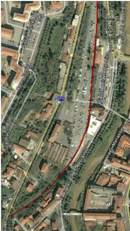
FIGURA 3: — Tracciato dal km 9+185