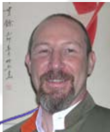
Carlo Amedeo Reyneri di Lagnasco