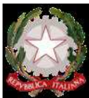
Ministero dell'Agricoltura, della Sovranità Alimentare e delle Foreste