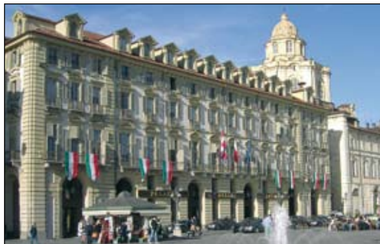
Palazzo della Regione