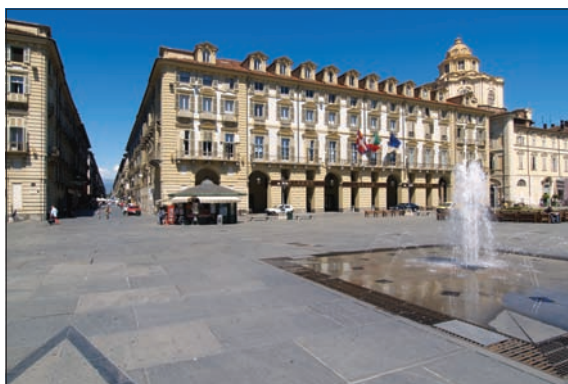
Palazzo della Regione