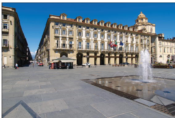
Palazzo della Regione

Piazza Castello 165, 10122 Torino - Tel. 011432 - 3299 / 4734 / 3994 / 4674 / 3559 - Fax 011432 4363 Sito internet: http://www.regione.piemonte.it e-mail: bollettino.ufficiale@regione.piemonte.it