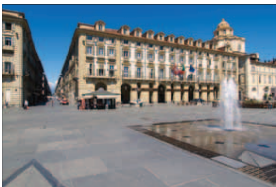
Palazzo della Regione