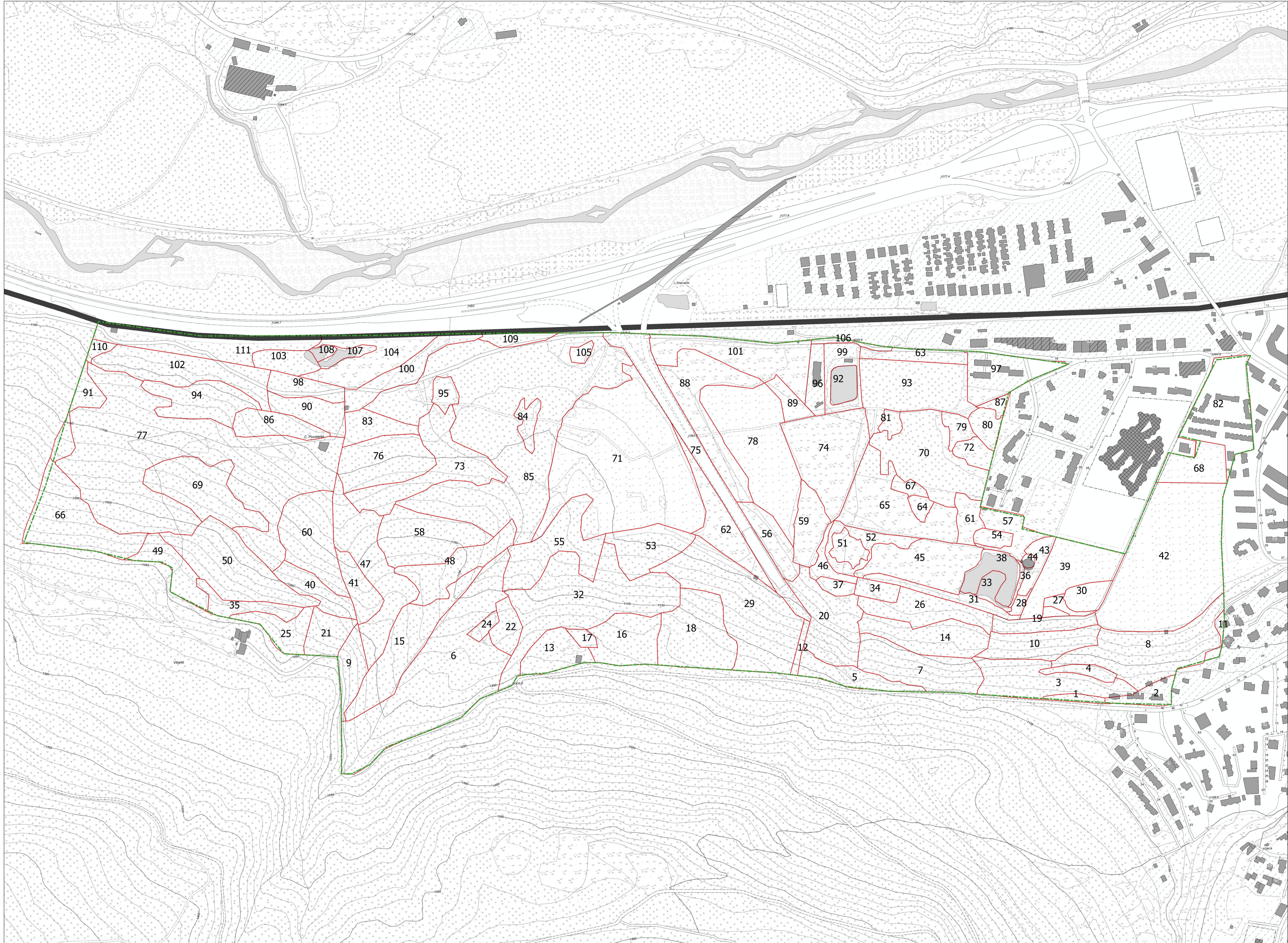
TABELLA DEGLI HABITAT PRESENTI NEI POLIGONI DELIMITATI IN PLANIMETRIA

1 DELIMITAZIONE DEGLI HABITAT nella tabella riportata a lato sono individuati per ciascun poligono rappresentato le tipologie di habitat (principali secondario 1 e 2) e le relative percentuali di copertura