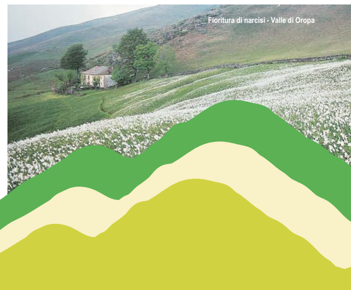
Fioritura di narcisi - Valle di Oropa

Sono in via di definizione percorsi per disabili e per le scuole. Le indicazioni verranno pubblicate sul sito www.turismo.biella.it .