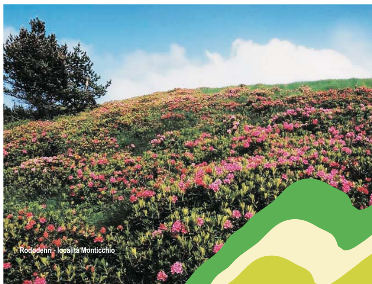
Rhododendri - località Monticchio

Sabato 28 maggio Transumando. Percorso al seguito di una mandria da Camandona (frazione Cerale, ore 8.30 circa) seguendo la "Strada dell'alpe" fino al Bocchetto Sessera. Da qui sarà possibile raggiungere l'alpe Moncerchio dove è in programma una festa dell'accoglienza in alpeggio. (DocBi, Oasi Zegna) Per info: DocBi +39 015 7388393 - Oasi Zegna - alpeggio di Monte Cerchio +39 339 7289682 oasizegna@zegnaermenegildo.it , www.oasizegna.com , www.docbi.it