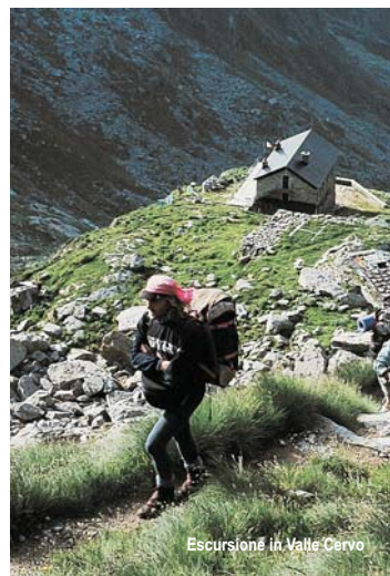
Escursione in Valle Cervo