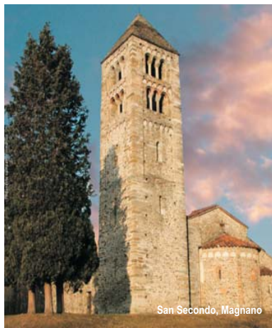
San Secondo, Magnano