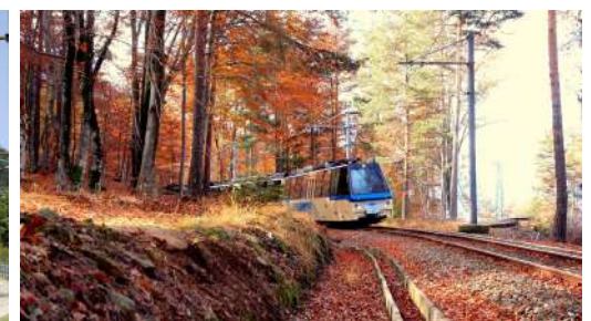
Tre immagini del suggestivo percorso della Ferrovia Vigezzina-Centovalli

mozioni e visioni sempre differenti, seguendo i ritmi naturali delle stagioni. La ferrovia col-