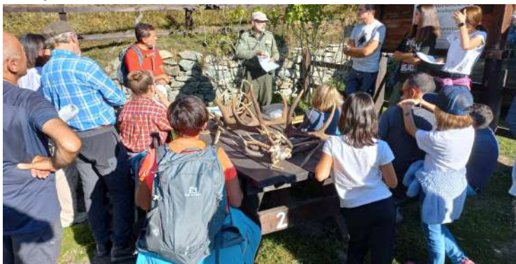
Dall'alto: immagini dei Parchi protagonisti del progetto regionale Nati con la Natura . Al centro una foto al tramonto nel Parco del Po piemontese. Qui sopra un evento nei Parchi Alpi Cozie