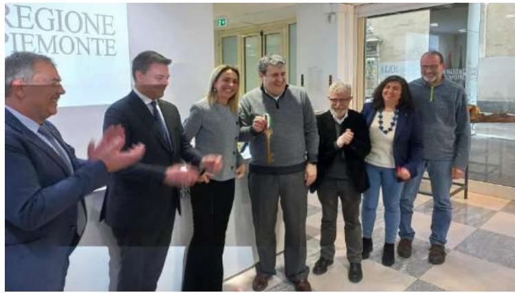
La simbolica cerimonia di consegna delle chiavi dell'Academy