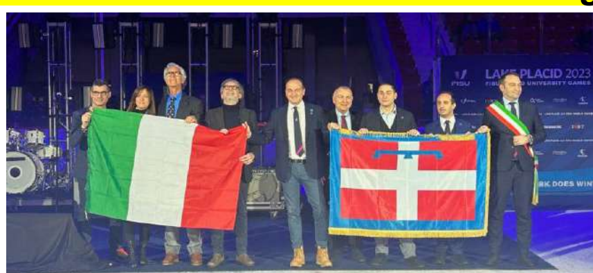
La delegazione piemontese a Lake Placid, con le bandiere italiana e del Piemonte. I Giochi Mondiali Universitari Invernali del 2025 si svolgeranno in terra piemontese